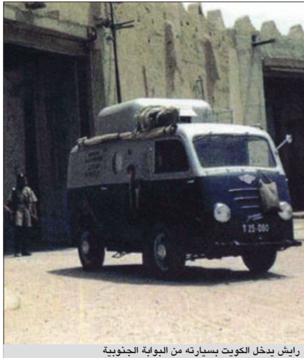
رايش يدخل الكويت بسيارته من البوابة الجنوبية

ويعمد أن فرغت من قراءة البرقية والرسالة هدأت وانركت قيمة البلد المتحضر حقا كالكويت، فالآن يستطيع المرء أن يتصل تلغرافيا من الكويت بكل دول