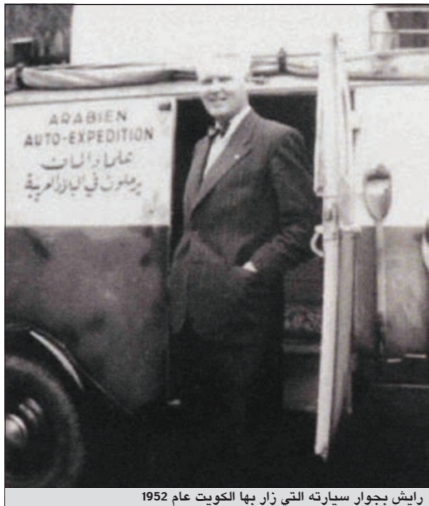
رايش بجوار سيارته التي زار بها الكويت عام 1952