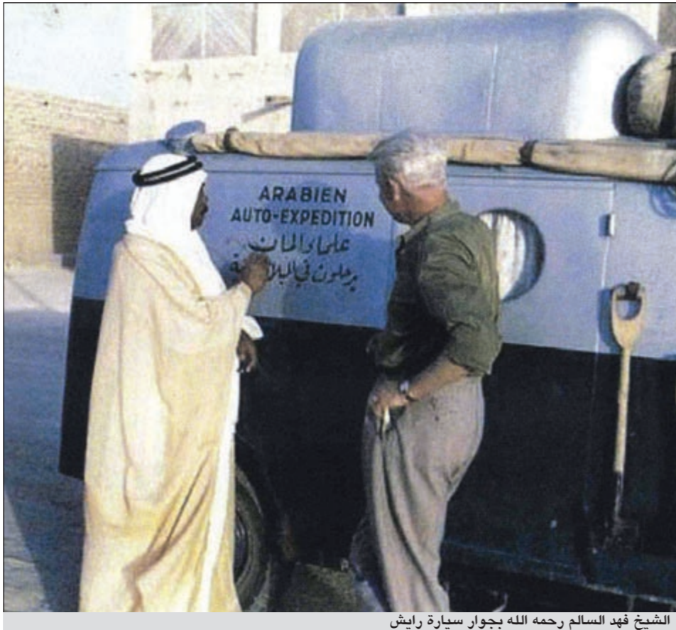
الشيخ فهد السالم رحمه الله بجوار سيارة رايش

كانت سيارتي وافقة على شارع الكورنيش امام بيت الضيافة طيلة فترة اقامتي بالكويت، وقد عانيت كثيرا بسبب مظهرها الغريب الذي كان اشبه ببيت يقف على أربع عجلات، وكانت فترة الاستراحة في المنزل تتيح لكثير من المواطنين الكويتيين الفرصة ليسألوا عن سيارتي ومواصفاتها والاطلاع عليها ومشاهدة ما فيها، ولم نستطع غلق الابواب على انفسنا بالاقفال لانها غير موجودة في الكويت، فالكويتيون شعب امين ومخلص، وقد الهبت سيارتي خيال المهندسين التقنيين العرب بتصميمها الغريب واثاثها الفريد من الداخل (خزانة الملابس، المنضدة، المكتبة، الالة الكتابة، صنوبر الماء، حوض الغسيل، السريران، المطبخ، واستطيع ان اقول انني فقط في الكويت قمت بفتح سيارتي للراغبين في مشاهدتها من الداخل قرب الاربعين مرة، وقد اضطرت سيارتي في حاجة الى الصيانة بشكل عاجل بعد وصولي إلى الكويت عبر الاراضي السعودية، فتكرم الشيخ فهد السالم الصباح بمنحي موافقة لتصليحها في ورش التصليح الخاصة بسيارات سمو الامير، وتسلمت تصريحا بالمرور عبر بوابة المتزة الكبير الذي يقع خلف بيت سمو امير الكويت، وهو مجرد بيت متواضع جدا لاغنى رجل في العالم وليس قصيرا فخما، وهو الشيء الدهش الذي يحير العقول، فهو رجل متواضع جدا في معيشته ونظام حياته. وحقيقة فإنني لم اشاهد مثيلا لورشة تصليح سيارات سمو الامير في كل الدول العربية التي زرتها، فلكويت تستورد احدث الماكثن من انجلترا واميركا وتجلب افضل المهندسين والعمال التقنيين، فالامير كان ذكيا وبعيد النظر وواسع الافق.