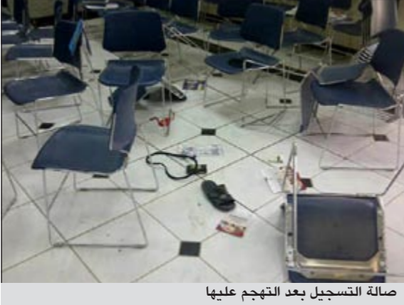
صالة التسجيل بعد التهجم عليها