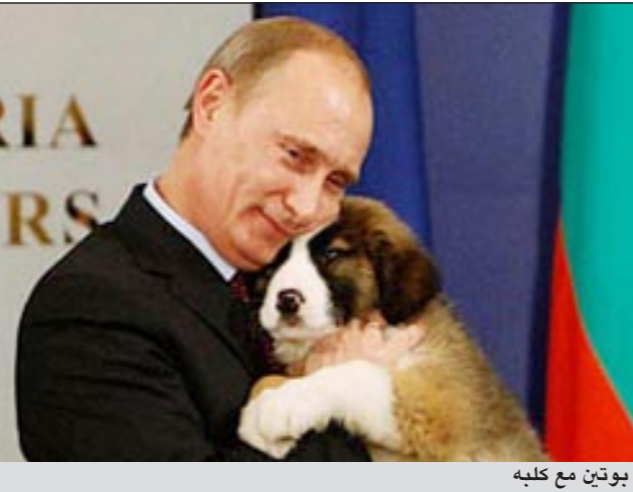
بوتين مع كلبه

مساعدا له، على غرار الرجل الوطواط ومساعد روين. في موضوع مشابه المادة الفيلم الأمريكي «Speed»، (1994)، بطولة كيانو ريفز وساندرا بولوك، تظهر الحلقة الأولى بوتين بعبادة الجودو وهو ينقذ ركب حافلة من انفجار قنبلة مخبأة فيه ومبرجة على الانفجار في حال قلت سرعة الحافلة عن 80 كيلومترا في الساعة.