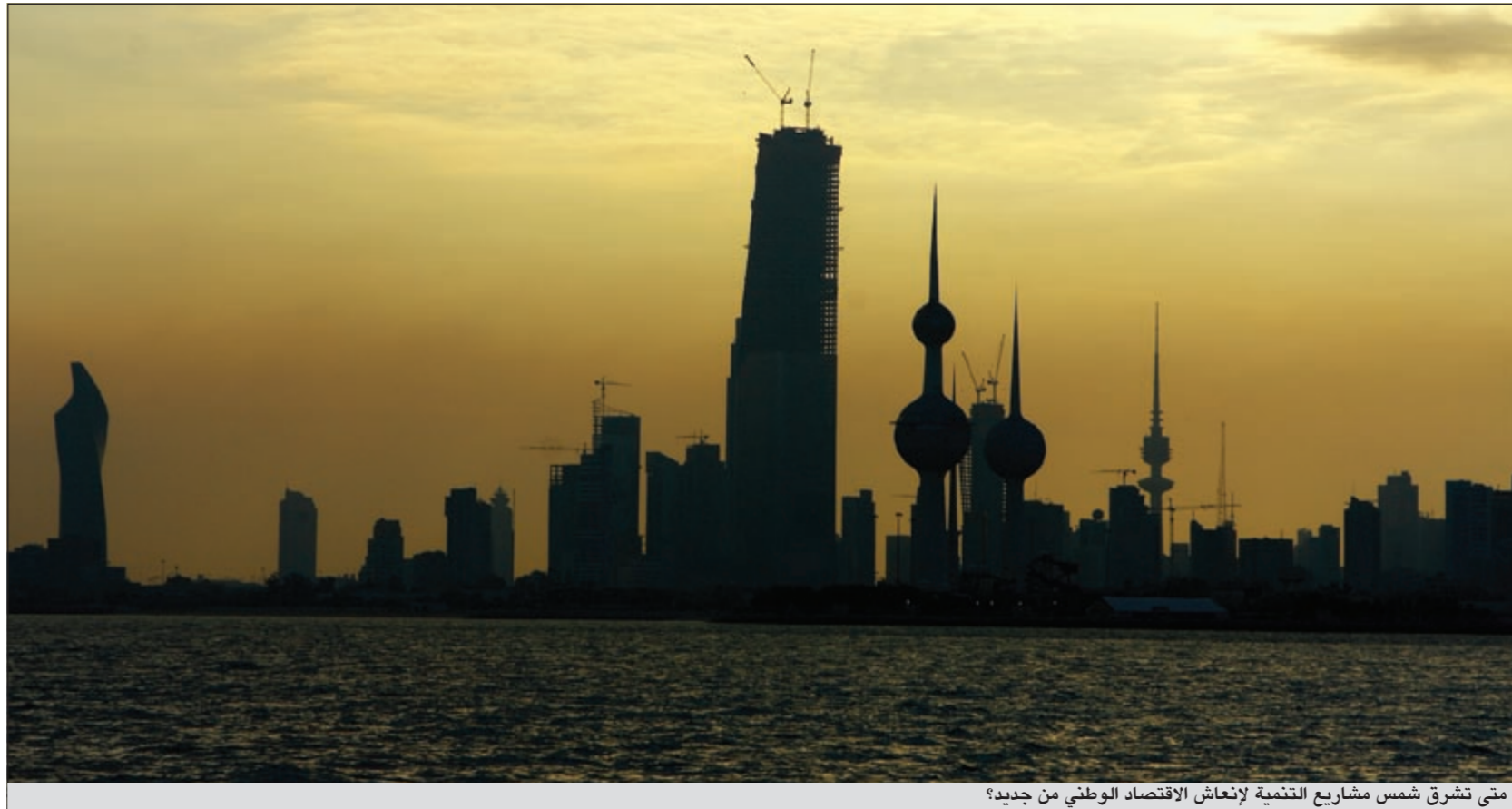
متى تشرق شمس مشاريع التنمية لإنعاش الاقتصاد الوطني من جديد؟

وأوضح زينل في ذات السياق ان تراجع أداء البورصة والعزوف عن التداول أدى الى قلة الإقبال