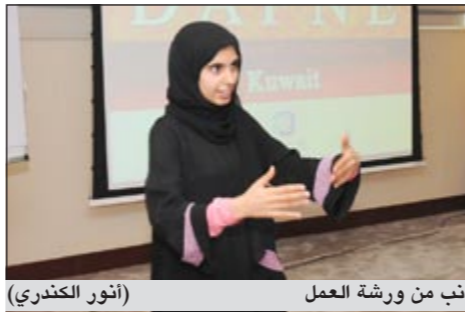
جانبا من ورشة العمل