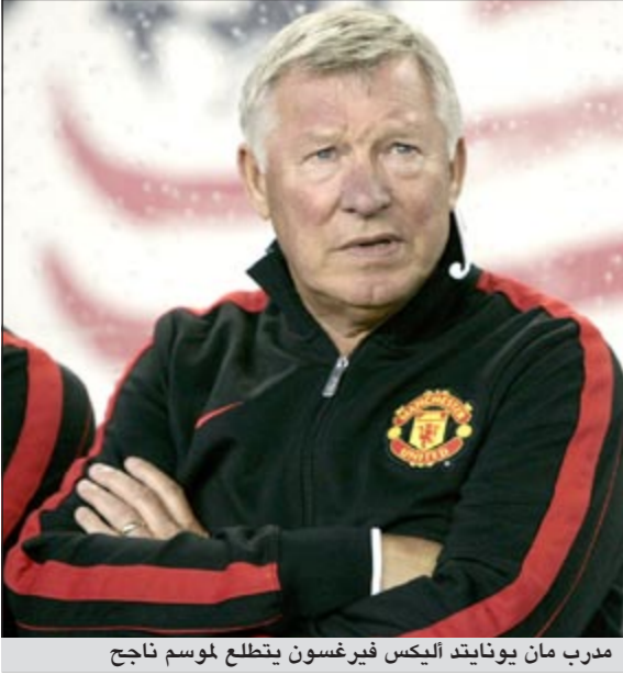
مدرب مان يونايتد اليكس فيرغسون يتطلع لموسم ناجح

حث المدرب الإسكوتلندي اليكس فيرغسون لاعبي فريقه مان يونايتد الإنجليزي على أخذ العبر من الهزيمة التي منيها بها الموسم الماضي أمام برشلونة الإسباني في نهائي دوري أبطال أوروبا لكرة القدم، من أجل ازاحة النادي الكاتالوني عن العرش القاري.