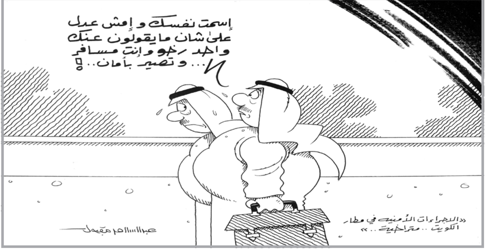
«الاجراءات الأمنية في مطار الكويت .. متراخية ..»