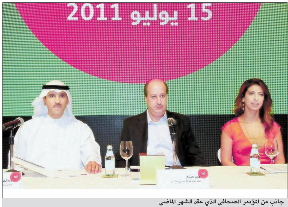
جانب من المؤتمر الصحافي الذي عقد الشهر الماضي

ولكي تمنح المشاهدين فرصة متابعة المسلسلات ومشاهدة البرامج التي تعرض على القناة، قامت «الوطنية» بإطلاق الصفحة الإلكترونية www.wataniya.com/tv التي ستضم محتوى القناة وجدول البرامج والمسلسلات ومواعيد بثها واعادتها، ليس هذا فحسب، بل سيتمكن زوار الموقع والمشاهدون من إبداء آرائهم ومقترحاتهم والتفاعل اجتماعياً مع الآخرين بشكل مستمر. وكما أعلنت في وقت سابق، فإن قناة «الوطنية» ستقدم خلال شهر رمضان عدداً من البرامج التلفزيونية التي صممت لتناسب جميع أفراد العائلة، منها برنامج