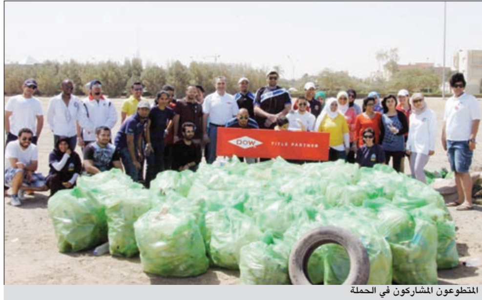
المتطوعون المشاركون في الحملة

المتطوعون وأعضاء من مختلف المنظمات غير الربحية مثل فريق الغوص Climate Change Project وشركة الهدف الأخضر (GTC)، وجمعية الهلال الأحمر الكويتية، Spread The Passion، وK'SPATH، بالاشتراك في حملات تجميع النفايات البرية والبحرية على شاطئ الدوحة وجزيرة أم المرادم. وتماشياً مع الجهود المتواصلة لحماية الحياة البرية والبحرية، قام برنامج داو لحماية البيئة البحرية بتشجيع الشباب على الانضمام من خلال المعارض المحلية والمنتديات التجارية، والتي تشمل معرض كويتي وأقنح، ومعرض الشهر البيئي بالكويت، ومعرض الكويت للطاقة والماء والكهرباء 2011، والمعرض المهني في كلية البنات في جامعة الكويت، وتم تسجيل المتطوعين الحاضرين في المعارض لمنحهم فرص المشاركة في حملات