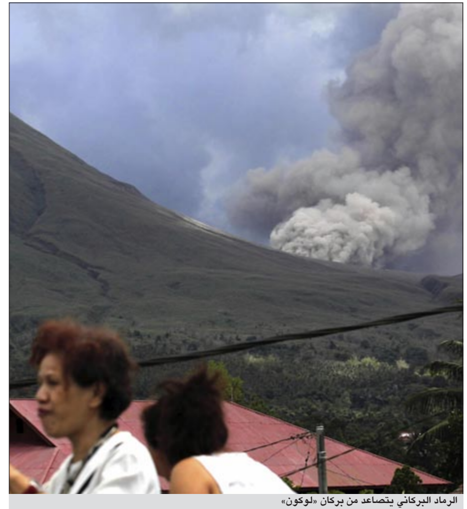
الرماد البركاني يتصاعد من بركان «لوكون»

جاكرتا - أ.ش.أ: وقع امس انفجار كبير في بركان جبل لوكون وسمع دوي الانفجارات في باطن البركان على بعد مسافات كبيرة.