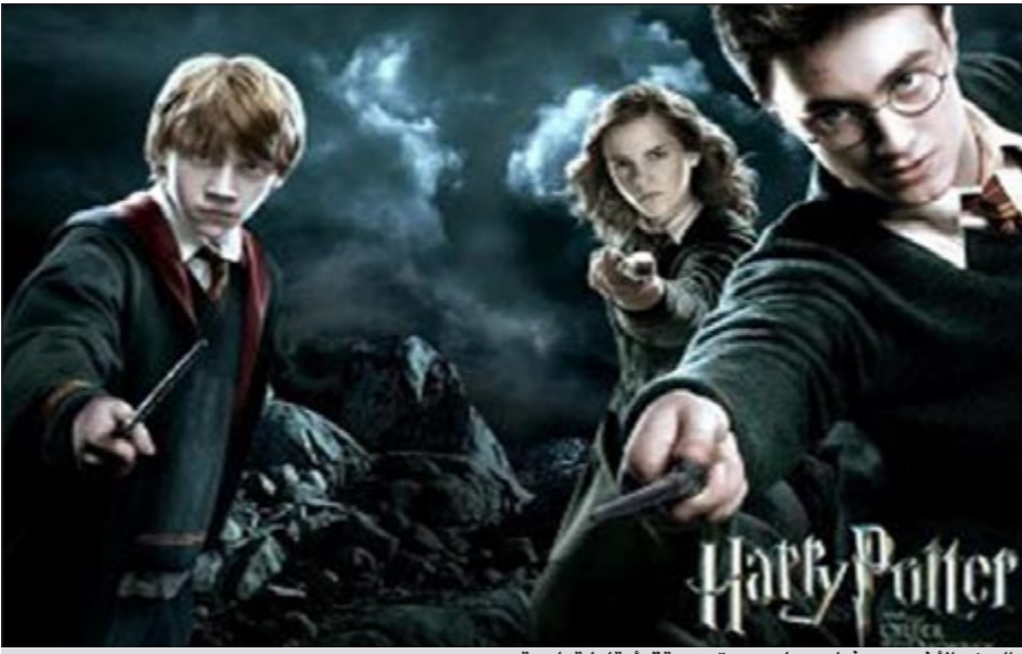
الجزء الأخير من فيلم «هاري بوتر» حقق أرقاماً قياسية

يحتل الفيلم الجديد أرقاماً قياسية سجلت سابقاً مثل إيرادات بقيمة 158,4 مليون دولار سجلها فيلم «دارك نايت» في إحدى عطل نهاية الأسبوع في يوليو 2008.