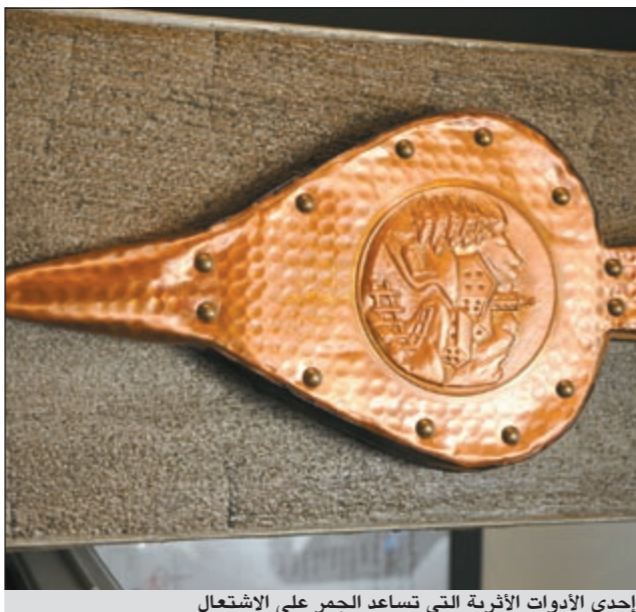
إحدى الأدوات الأثرية التي تساعد الجمر على الاشتعال