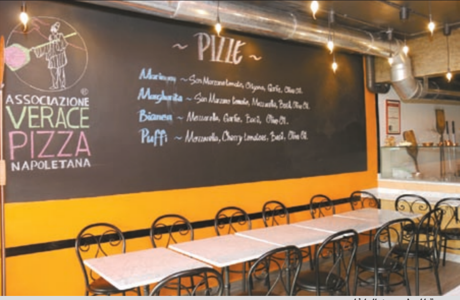
صورة للمطعم من الداخل

وصلصة الطماطم والريحان وزيت الزيتون الخالص، ورغم أن هناك أنواعا أخرى، إلا أننا نقدم شيئا فشيئا ليعرف الناس على مذاق البيتزا الأصلية، وإضافة إلى ذلك فإننا نقدم القهوة وبعض أصناف الحلوى الإيطالية. مكونات أصلية ما الذي يميزكم عن مطاعم صناعة البيتزا في الكويت؟ وما سر نجاح البيتزا الإيطالية؟ ● «سولو بيتزا نابوليتانا» يعتبر أول مطعم في الكويت يحصل على شهادة الجودة الفائقة في صناعة البيتزا من منظمة صناعة البيتزا الإيطالية التي تتخذ من نابولي مقرا لها، وهي منظمة غير ربحية أنشئت للحفاظ على تراث البيتزا الأصلية وفقا لمواصفات وضوابط وشروط معينة، ونشر هذا التراث حول العالم، وبالتالي، فإن أي مطعم ملتزم بالشروط والمواصفات يضمن إلى هذه المنظمة ورقمنا التسلسلي على مستوى العالم هو 353.