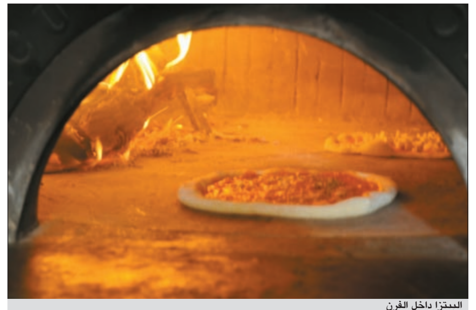
البيتزا داخل الفرن