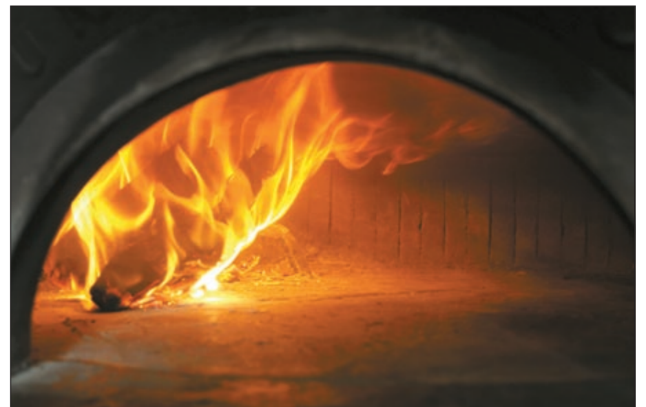
الفرن الإيطالي الأصلي المستورد من «نابولي» يوقد بحطب خاص من بعض الأشجار