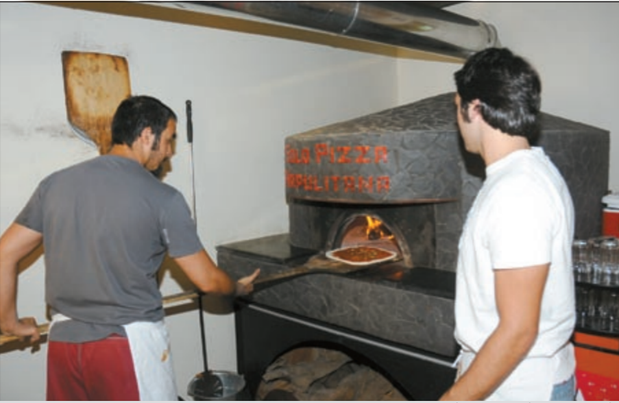
فطيرة البيتزا في طريقها للفرن