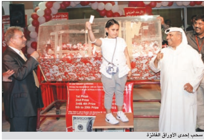
سحب إحدى الأوراق الفائزة

تتوافر خمس من ساعات Tissot TXL Lady على سوار مذهل بنمط نقوش جلد التمساح، المدهشة، باللون الفيروز، الأخضر الزاهي، الأصفر، الأسود أو الأبيض اللؤلؤي. ويضم الثنائي المتبقي سواراً أنيقاً مصنوعاً من الفولاذ المقاوم للصدأ، يتألف من خمسة صفوف من الوصلات الأنيقة، بأسلوب المجوهرات المعاصرة بوضوح. إضافة إلى خيار الميناء الأسود أو الفضي، الذي يضمن أن الكلمة الأخيرة هي دائماً للمتطور. تخلق المؤشرات والعلامات حول الميناء صورة بصرية خادعة بأنها ثلاثية الأبعاد حيث أنها تتفتق بمهارة بعيداً عن اتجاه مركزها. وتشمل المسمات الأخيرة المشابهة على شكل