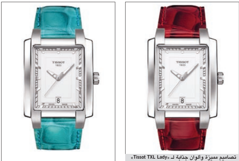
تصاميم مميزة واللون جذابة لـ «Tissot TXL Lady»