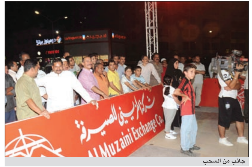
جانب من السحب

شارع عمان يوم 2011/7/14 في تمام الساعة 7:30 مساءً على 20 جائزة نقدية بقيمة أكثر من 71,000 دولار.