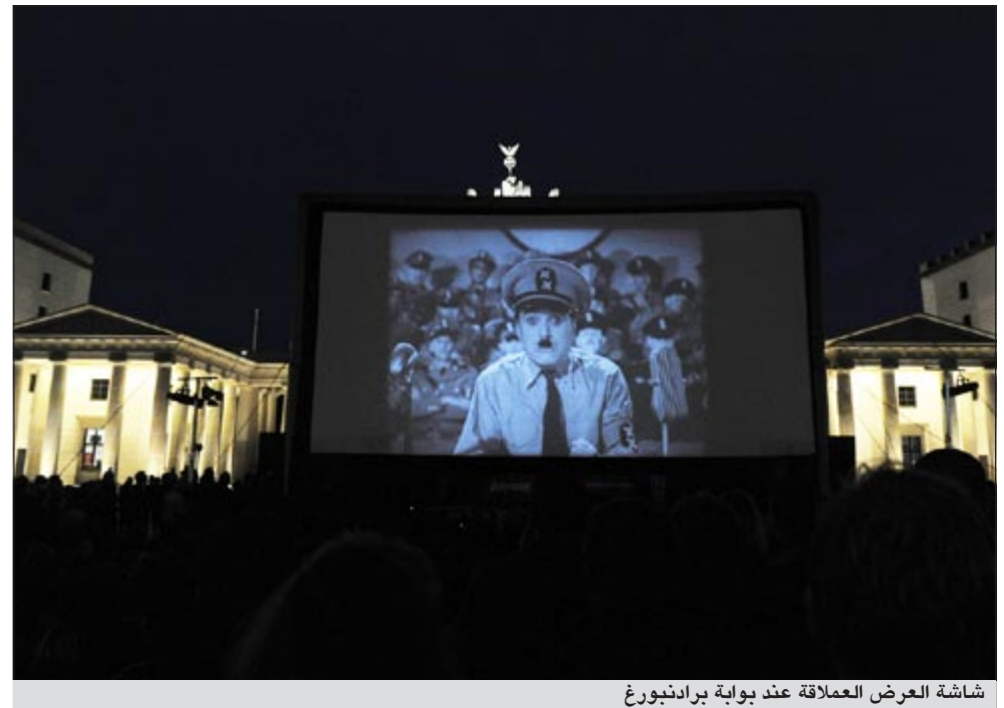
شاشة العرض العملاقة عند بوابة برادنبورغ

برلين - أ.ف.ب: تم عرض رائعة شارلي شابلان «ذا غريت ديكتاتور» الذي صور سنة 1940 وتصور أحداثه حول برون شبيبه لهتلر، على شاشة عملاقة مساء الجمعة عند بوابة برادنبورغ، بعد 80 عاما على زيارة الممثل والمخرج لبرلين. ويحكي الفيلم قصة حلاق يهودي يحل بالخطأ محل الديكتاتور المعادي للسامية في بلد من نسيج الخيال اسمه تومانيا، ويغزو بلد