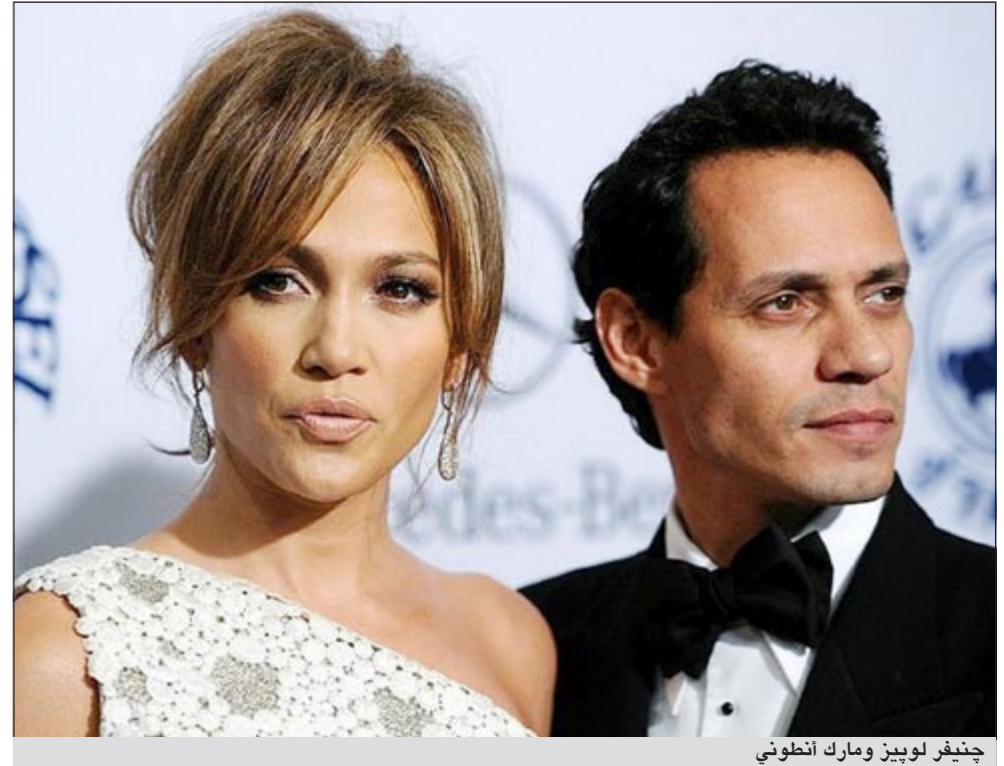
چنيفر لوبيز ومارك أنطوني

لوس انجليس - أ.ف.ب: أعلنت المغنية والممثلة الأميركية چنيفر لوبيز وزوجها الثالث مارك أنطوني أول من أمس لمجلة «بيبول» عن طلاقهما وديا بعد 7 سنوات من الزواج. وشرح الفنانان في بيان مشترك نشرته المجلة «لقد قررنا إنهاء زواجنا. كان ذلك قرار صعب جدا. لقد توصلنا إلى اتفاق ودي».