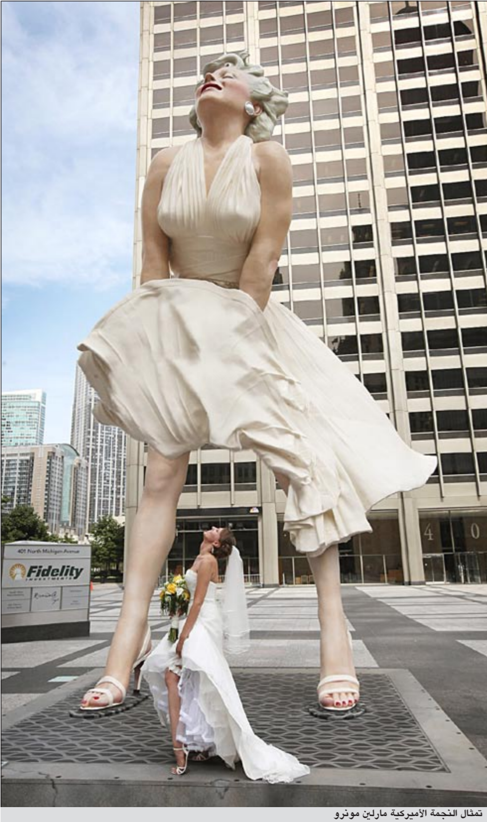
تمثال النجمة الأميركية مارلين مونرو

وكشف عن التمثال الذي يبلغ ارتفاعه 7,92 مترا في شارع ميتشيفن وهو يتنوع من مجموعة «زبلر ريالتي» وهو تجسيد فعلي لشكل مونرو بفستانها الأبيض المتطاير الذي تحاول منعه من الكشف عن مفاتيحها.