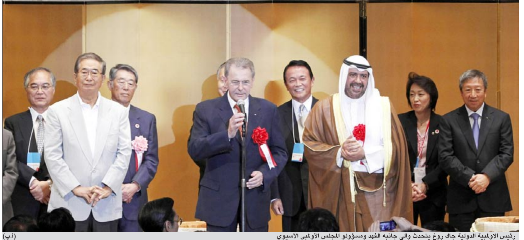
رئيس اللجنة الدولية جاك روغ يتحدث والى جانبه الفهد ومسؤولو المجلس الأولمبي الآسيوي