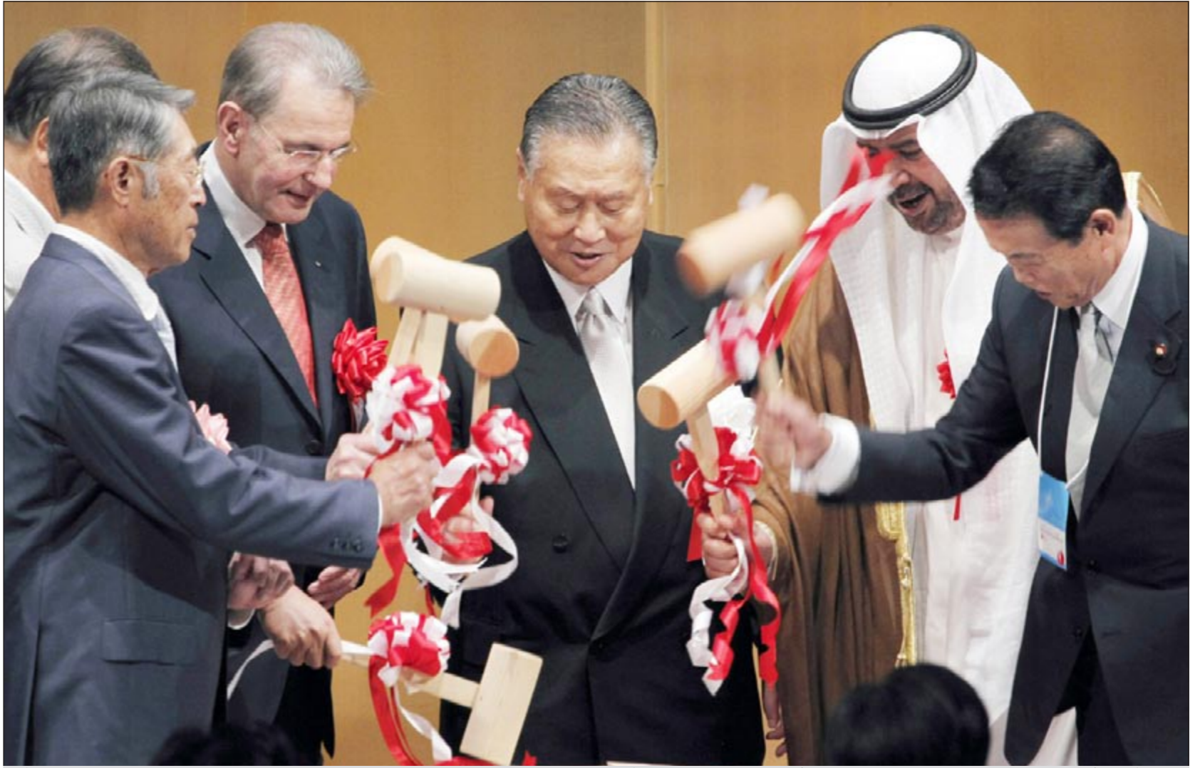
الشيخ أحمد الفهد يشارك المسؤولين اليابانيين الإعلان عن بدء الحفل بمناسبة الذكرى المئوية للأولمبية اليابانية

وأكد تأكيدا الذي تولى منصب نائب رئيس المجلس الأولمبي الآسيوي بعد الانتخابات ان آسيا أصبحت الآن قوة رياضية في العالم مشيدا بحرص الشيخ احمد على توفير فرصة عادلة وبيئة مناسبة لكل رياضي القارة لممارسة الرياضة.