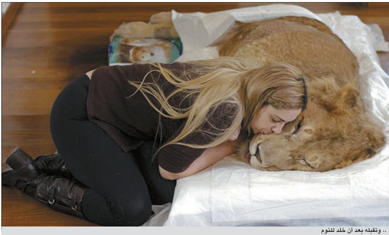
.. وتقبله بعد ان خلد للنوم

البرازيلية بيريرا، إنه لأسباب غير معروفة فإن كرات الدم البيضاء للأسد هاجمت خلايا الأخرى وتسببت له في نكسة صحية أثرت على نخاعه وأضرت بوظائفه الحركية.