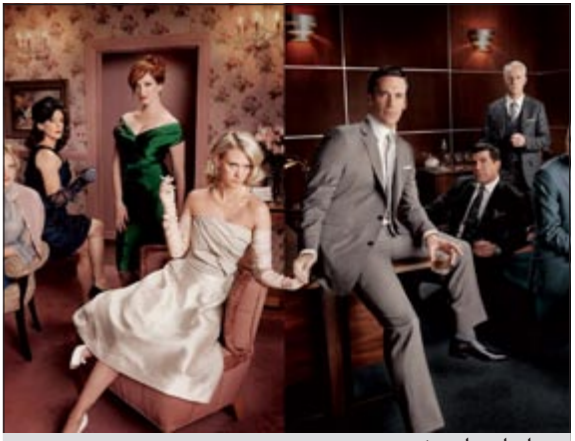
مسلسل «ماد مين»

لوس أنجيليس - د.ب.أ: تصدر مسلسلا «ماد مين» و«بوردوك امباير» الأعمال المرجح فوزها بجوائز «إيمي» التلفزيونية المرموقة لهذا العام، بعد إعلان الترشيحات الخميس في لوس أنجيليس.