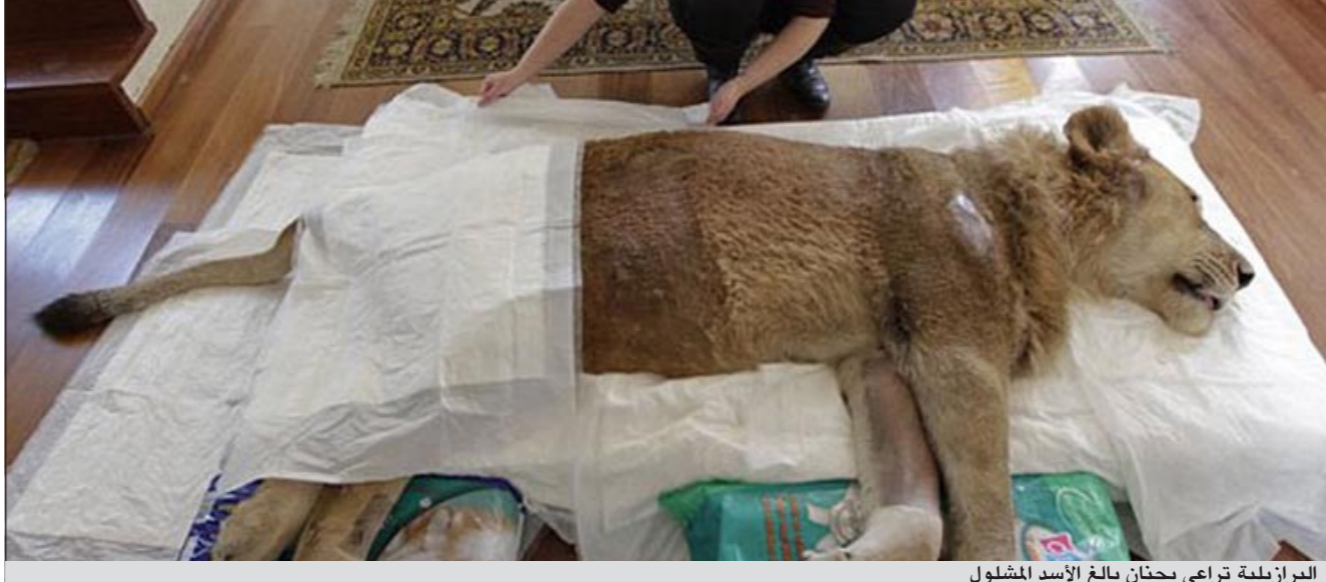
البرازيلية تراعي بحنان بالغ الأسد المشلول