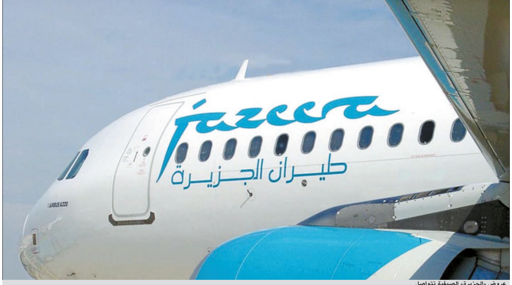
عروض «الجزيرة» الصيفية تتواصل

أظهر تقرير متخصص أن السياح السعوديين في لبنان هم الأكثر إنفاقاً بنسبة 20% من إجمالي ما ينفقه الأجانب الذين يزورون البلاد، وأتى الإماراتيون بنسبة 12% والكويتيون بنسبة 9% والسوريون والمصريون بنسبة 8% و6% على التوالي. وأوضح التقرير أن إنفاق السياح في لبنان نما بنسبة 3% حتى مايو الماضي، مقارنة بالأشهر الخمسة الأولى من العام الحالي، الذي سجل بمجمعه عدد سياح قياسي بلغ 2,1 مليون سائح، ليكون بذلك إنفاق السياح هو الأكبر عربياً. وتركز الإنفاق، وفقاً للتقسيم