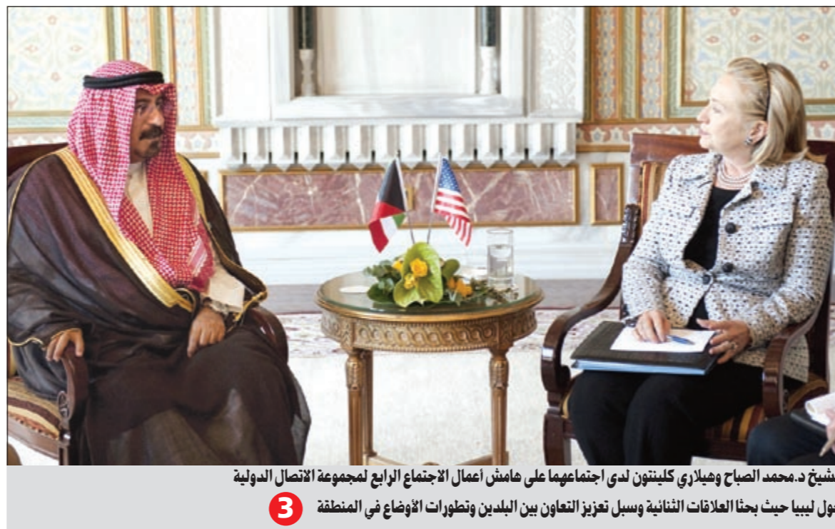
الشيخ د.محمد الصباح وهيلاري كلينتون لدى اجتماعهما على هامش أعمال الاجتماع الرابع لمجموعة الاتصال الدولية حول ليبيا حيث بحثا العلاقات الثنائية وسبل تعزيز التعاون بين البلدين وتطورات الأوضاع في المنطقة 3