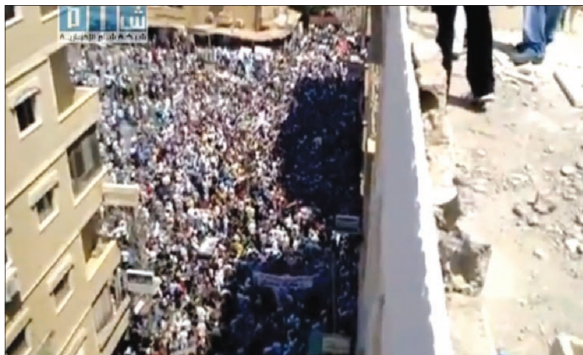
صورة مأخوذة عن الانترنت لجانب من المظاهرات التي خرجت في دير الزور أمس

مرتبطة بالقيادة الإيرانية ان الزعيم الأعلى آية الله على خامنئي يوافق على فكرة المساعدة التي عرضت في تقرير سري لمركز الأبحاث الاستراتيجية المرتبط بالقيادة الإيرانية. ولم يتسن التحقق من صحة التقرير. وقالت ليزيكيو ان إيران قد ترسل أيضا 290 ألف برميل من النفط يوميا الى سورية خلال الشهر المقبل وتساعد على تعزيز إجراءات مراقبة الحدود لمنع السوريين من الفرار الى لبنان وبحوزتهم أموال.