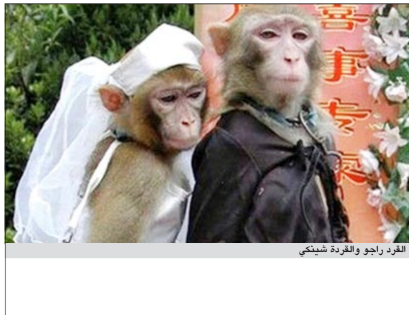
القرد راجو والقردة شينكي