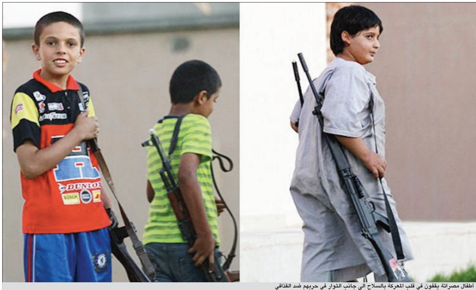
أطفال مصراتة يقفون في قلب المعركة بالسلاح الى جانب الثوار في حربهم ضد القذافي

وقال المحمودي في مؤتمر صحفي في طرابلس إن الحكومة أنهت الآن كل تعاون لها مع ايني وهي أكبر شركة أجنبية في البلاد والتي تعمل في ليبيا منذ خمسينيات القرن الماضي. وتابع المحمودي كذلك أن الحكومة في طرابلس تجري محادثات مع شركات روسية وصينية وأميركية بشأن مشروعات جديدة في ليبيا وإن لم يورد مزيد من التفاصيل. وقال إن حكومة القذافي مستعدة