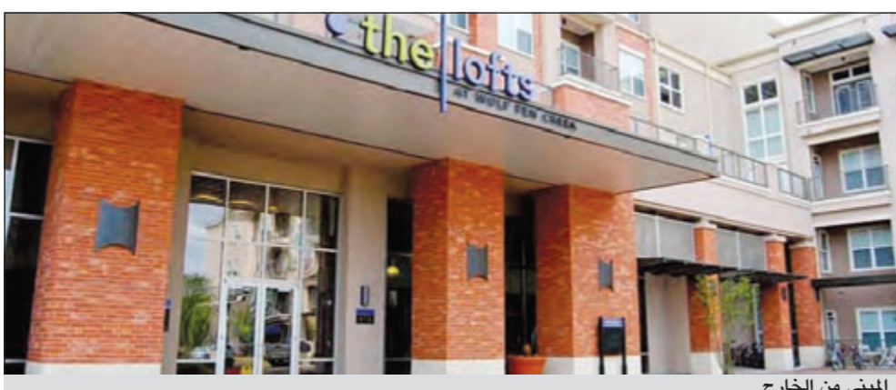
المبنى من الخارج