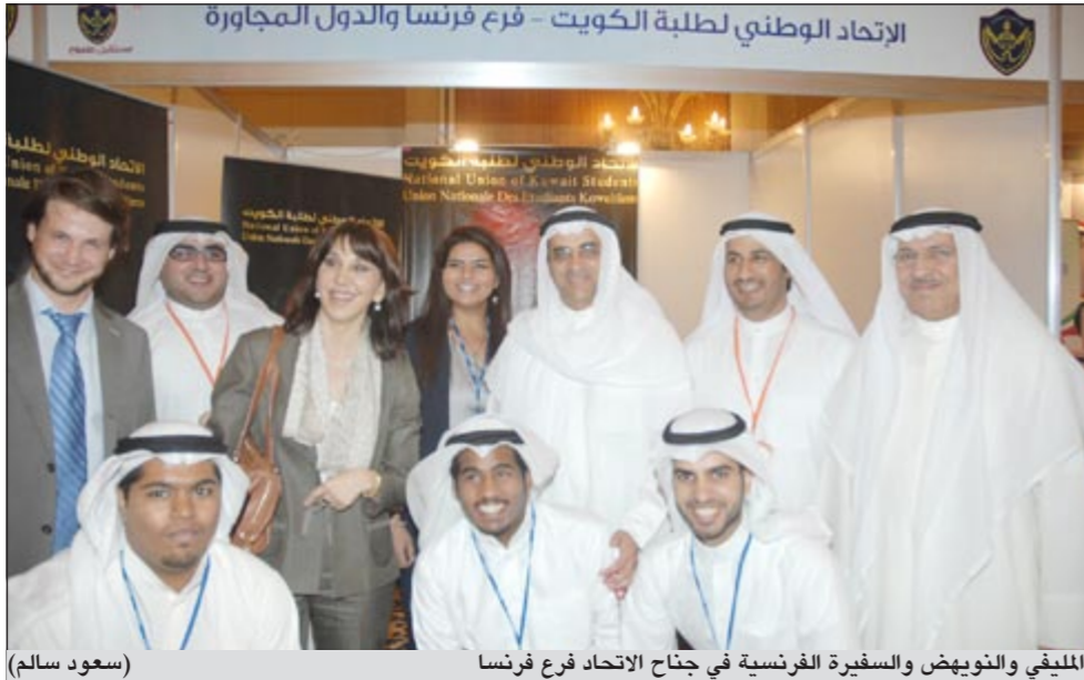
المليفي والنويهيض والسفيرة الفرنسية في جناح الاتحاد فرع فرنسا (سعود سالم)

على أي استفسارات لهم حول الجامعات الموجودة بالدول التي توجد بها هذه الفروع واشتراطات الجامعات هناك وهو ما يعكس حرص جميع فروع الاتحاد على ضمان نجاح المنتدى وتحقيقه لأهدافه، مشيرا الى ان هناك أكثر من 50 جامعة عالمية مشاركة في المنتدى عكست حجم الجهد الذي يبذل لتنظيمه وخروجه بهذا الشكل المشرف بتوفيق من المولى جل شأنه في المقام الأول.