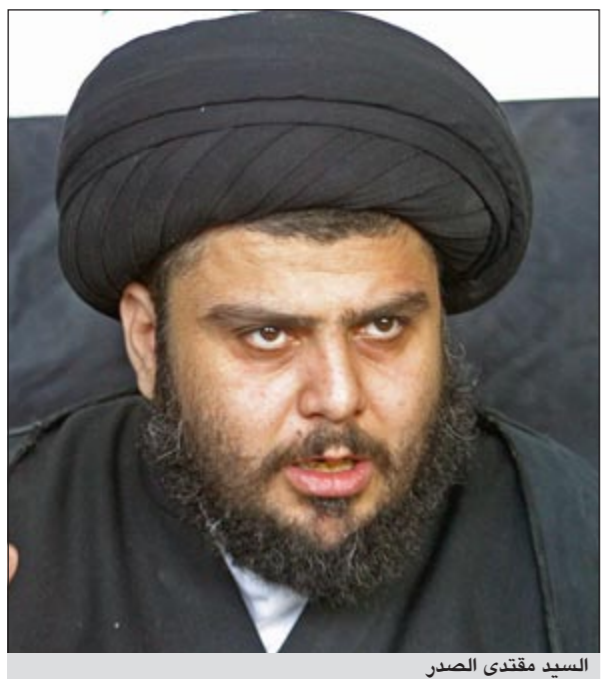
السيد مقتدى الصدر

لصحيفة طهران تايمز تعليقا على التعديل الوزاري الذي جرى قبل أيام على الحكومة الأردنية. وقال الحايقة في تصريح صحافي «إن هذه التصريحات مدانة ومستنكرة وهي تدخل سافر في الشؤون الداخلية للمملكة