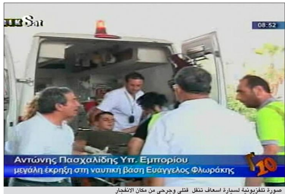
صورة تلفزيونية لسيارة اسعاف تنقل قتلى وجرحى من مكان الانفجار

برس. وسجلت اضرار جسيمة ايضا في قرية ماري المجاورة التي تم اخلاء سكانها البالغ عددهم 150 نسمة. وفيما اعلنت الحكومة القبرصية الحد الوطني لثلاثة ايام، علقت السلطات حركة السير على الطريق السريع الوحيد الذي يربط بين نيقوسيا في وسط الجزيرة وليماسول ثاني مدن البلاد. وقال سائقو سيارات كائوا في الموقع على الطريق الذي يمر على بعد حوالي كيلومتر عن المكان عند حدوث سلسلة الانفجارات انهم شاهدوا قطع حطام تتطاير في الهواء. ووقع الحادث نتيجة حريق اخرج من منطقة مجاورة، في معسكر اينفانغليس فلوراكيس في مكان وضعت فيه 98 حاوية من بارود المدافع تشكل جزءاً من