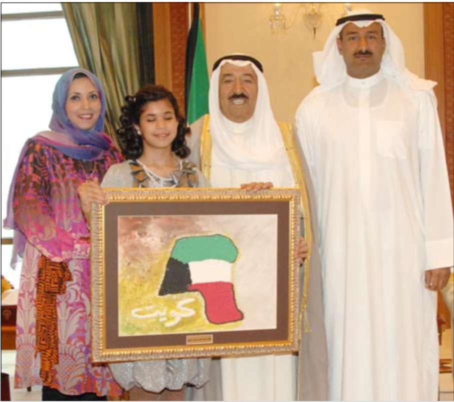
صاحب السمو الأمير الشيخ صباح الأحمد يتسلم لوحة فنية من الطالبة بسملة السعيد بحضور والديها

إلى ذلك، بعث صاحب السمو الأمير الشيخ صباح الأحمد ببرقية تهنئة إلى الرئيس تساخيا بيدورج رئيس جمهورية منغوليا الصديقة عبر فيها سموه عن خالص تهانبه بمناسبة العيد الوطني لبلادها، متمنياً له موفور الصحة ودوام العافية. كما بعث سمو ولي العهد الشيخ نواف الأحمد وسمو رئيس مجلس الوزراء الشيخ ناصر المحمد ببرقيتي تهنئة مماثلتين.