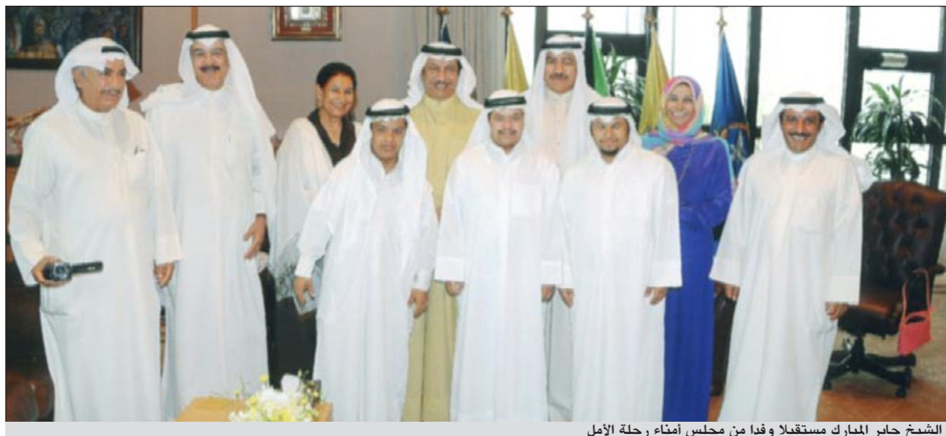
الشيخ جابر المبارك مستقبلاً وفداً من مجلس أمناء رحلة الأمل

الأمر المتعلقة بالبيئة، واستقبل الشيخ جابر المبارك أيضاً المدير الإقليمي لمجلة «دار الصيد» سامي زهر الدين. وحضر اللقاءات رئيس هيئة مكتب النائب الأول لرئيس مجلس الوزراء ووزير الدفاع الفريق صالح الحميضي.