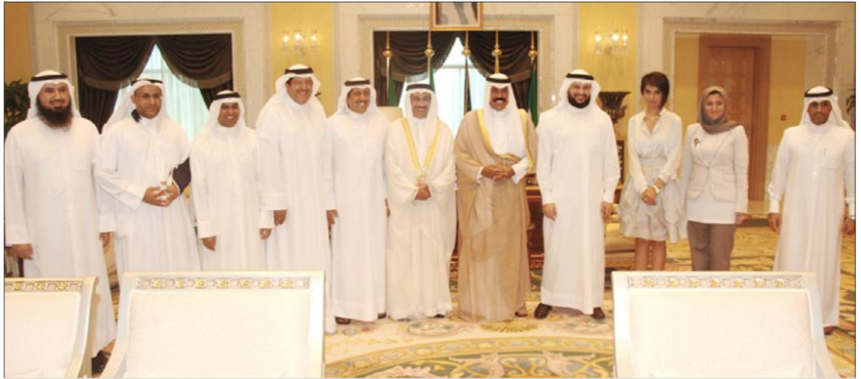
سمو ولي العهد الشيخ نواف الأحمد مستقبلاً رئيس وأعضاء مجلس إدارة جمعية المهندسين

وقد حضر المقابلة رئيس ديوان سمو ولي العهد الشيخ مبارك الفيصل واستقبل سموه بقصر السيف أمس أحمد باقر، كما استقبل سمو ولي العهد بقصر السيف أمس عضو مجلس الإمتة النائب حسين الحريتي.