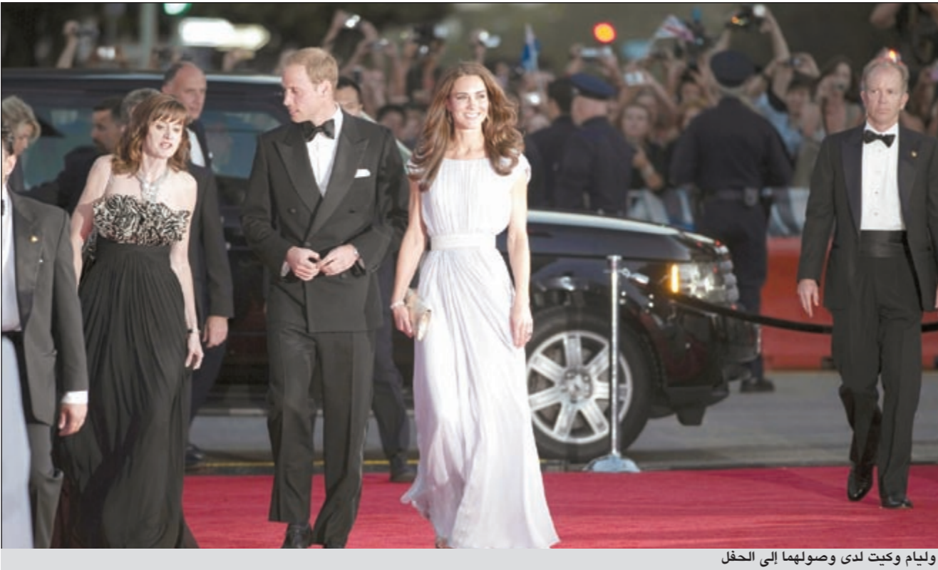
ويليام وكيت لدى وصولهما إلى الحفل

وباربرا سترايسند وبلايك لايفلي وماري لويز باركر وجاك بلاك وجنيفر غارنر المخرج كوينتين تارنتينو.