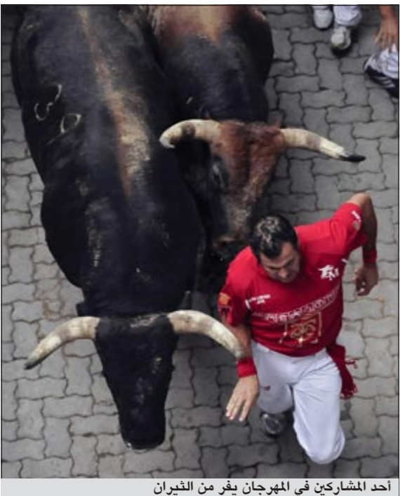
أحد المشاركين في المهرجان يفر من الثيران

ارتبطت مشاهد مصارعة الثيران عبر التاريخ باسم اسبانيا وأصبحت تراثا تقليديا دفع بعض الجهات في أنحاء العالم إلى مطالبة منظمة الأمم المتحدة للتربية والعلوم والثقافة (يونسكو) بإعلانه تراثا عالميا في بلد يحوي أكثر من 400 حلبية مصارعة يقتل فيها آلاف الثيران سنويا.