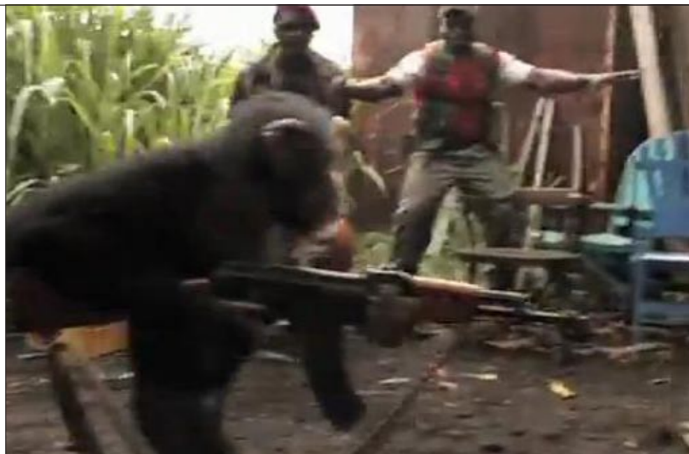
القرد حاملا الكلاشينكوف والجنود يفرّون من أمامه