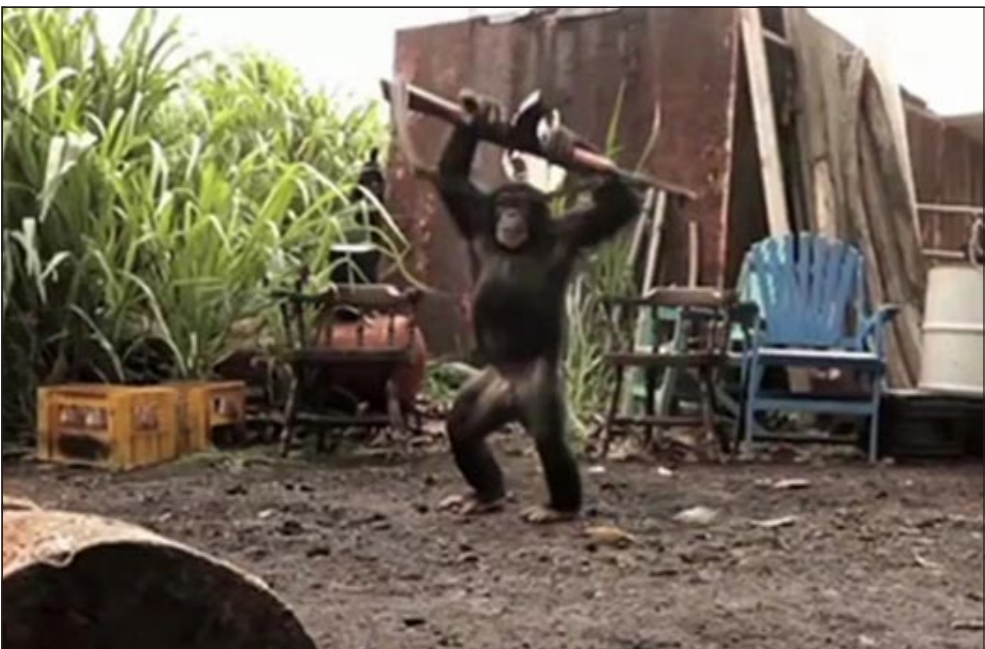
يرفع السلاح معلنا انتصاره

ويرجع الفضل في الشهرة العالمية للمهرجان للكاتب والروائي الأمريكي ارنست هيمينغواي الذي خلده في روايته «قم تشرق الشمس» عام 1962 جاعلا من انشطته مغامرة مليئة بالأحداث والتشويق جذبت آلاف الشباب حول العالم لتذوقها.