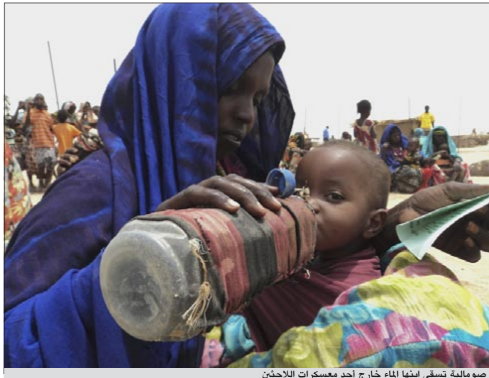
صومالية تسقي ابنها الماء خارج أحد معسكرات اللاجئين

أثيوبيا وكينيا والصومال. وقالت ان استمرار القحط والجفاف في المنطقة طيلة أكثر من 60 عاما أدى إلى نفوق أعداد لا حصر لها من الماشية والحيوانات وأدى لارتفاع أسعار الغذاء لتفوق قدرات الكثير من العائلات الفقيرة بالمنطقة.