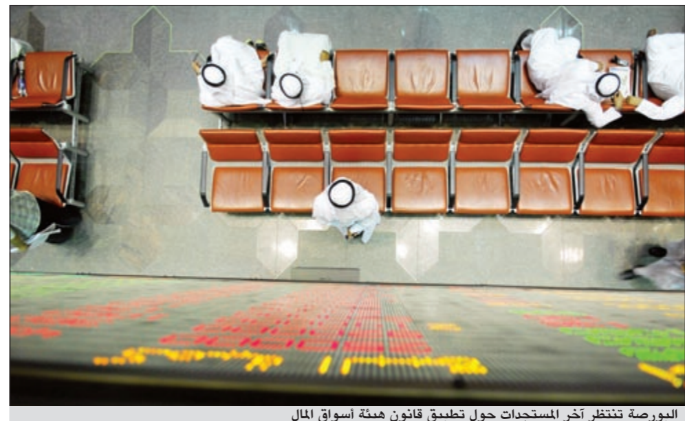
البورصة تنتظر آخر المستجدات حول تطبيق قانون هيئة أسواق المال