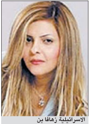
الاسرائيلية زهافا بن

قالت المطربة الإسرائيلية «زهافا بن» انها تحلم بالغناء لام كلثوم على أرض مصر وفي دار الاوبرا على وجه التحديد، وأضافت زهافا التي يطلق عليها لقب «أم كلثوم إسرائيل» - في حوار مع صحيفة «ايوك تايمز» العبرية ونشرته «الصري اليوم» القاهرية - انها تحلم بالغناء لام كلثوم في دار الاوبرا، وتابعت: «من الممكن أيضاً أن أقوم بتقديم أسطوانة مثل اليوم نقطة حظ» وهو الالبوم الاول لها الذي غنست فيه لام كلثوم، ونال شهرة واسعة في سوق الاغاني في إسرائيل. وفي الوقت نفسه اعترفت زهافا بصعوبة تحقيق حلمها، لانه لا