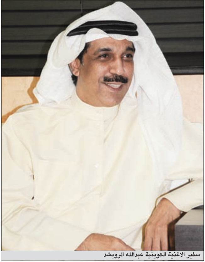
سفير الاغنية الكويتية عبدالله الرويشد

وعن الاغاني التي سيغنيها، ذكر سلطان الرومانسية سفير الاغنية الكويتية عبدالله الرويشد أنها ستكون مزيجاً من أغانيه القديمة والجديدة وبعض الاغاني