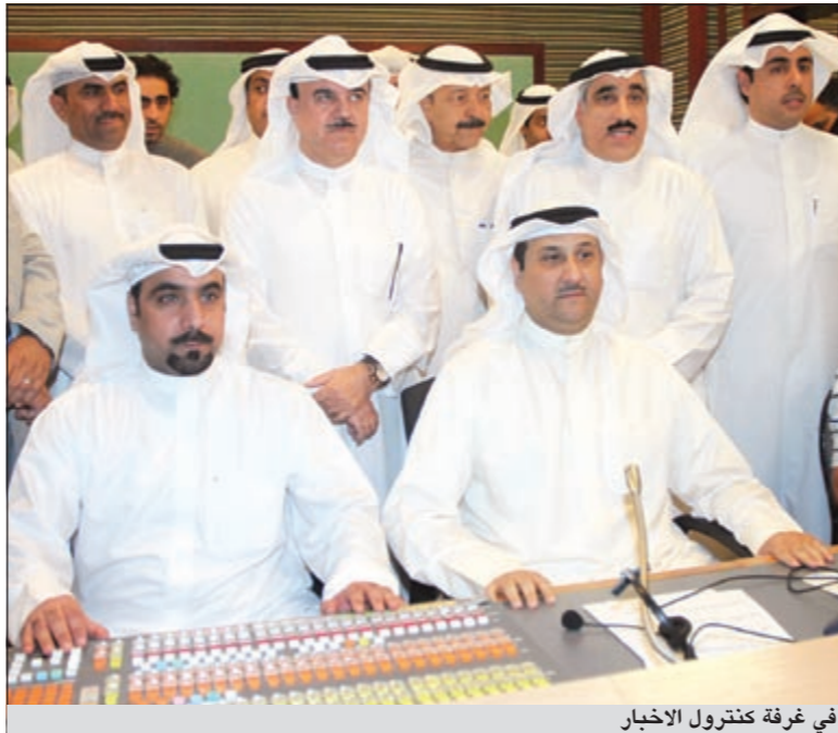
في غرفة كترول الاخبار

وأشار الى ان التطور الذي شهدته استديوهات قطاع الأخبار ستشهد معظم استديوهات تلفزيون الكويت في الفترة المقبلة، حتى تواكب التطور الإعلامي في ظل المنافسة الشريفة الموجودة بين المحطات الفضائية. وشكر