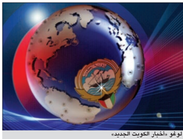
لوغو «أخبار الكويت الجديد»