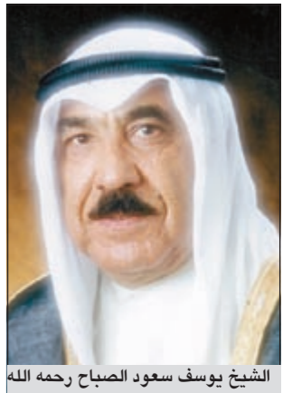
الشيخ يوسف سعود الصباح رحمه الله

أعلن الشيخ علي يوسف الصباح عن انطلاق بطولة الدامة بالكبوتر في شهر رمضان للعام السابع على التوالي باسم جائزة المرحوم الشيخ يوسف سعود الصباح، وذلك بالتعاون مع شركة المشروعات السياحية، وقال ان الهدف من هذه البطولة قد تحقق بالفعل ونجح بكل المقاييس وان اللعبة استقطبت عددا كبيرا من المهتمين سواء من الهواة او المحترفين، وأكد يوسف تعاون شركة المشروعات السياحية باحتضان البطولة وكذلك الشركات الراعية. من جانبه، أكد رئيس اللجنة المنظمة للبطولة د.نوري الوتار ان المستوى الفني الذي شهدته البطولة السادسة كان له دافع كبير في رفع مستوى المنافسة الى المستوى الـ 18، لافتا الى ان البطولة السابعة ستشهد منافسات قوية نظرا للمستويات الفنية التي ستشارك فيها. وأضاف الوتار ان البطولة ستعظم بالتعاون مع شركة المشروعات السياحية بالاسبوع الثاني من شهر رمضان بنادي البجوت، احد اهم مرافق الشركة. وتقدم د.نوري الوتار بالشكر والتقدير لراعي البطولة الشيخ علي يوسف الصباح