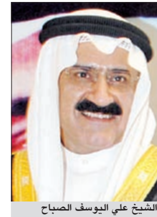
الشيخ علي يوسف الصباح