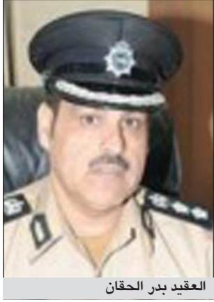
العقيد بدر الحقان

أعلن مدير عام الإدارة العامة للجنسية ووثائق السفر بالإتابة العقيد بدر الحقان عن بدء استقبال أبناء المجنسين الذين صدر المرسوم الأميري رقم 188 لسنة 2011 والخاص بمنح الجنسية الكويتية لهم والبالغ عددهم 73 مواطناً في الإدارة العامة للجنسية ووثائق السفر اعتباراً من اليوم الإثنين من الساعة الرابعة عصراً وحتى الثامنة مساءً. وحت المشمولين بالمرسوم الأميري على احضار جميع المستندات الأصلية ودفع رسوم قدرها دينار واحد إذ سيتم تسليمهم الجنسية على الفور. وأشار إلى أنه تم اختيار الفترة المسائية موعداً للمراجعة تفادياً للازدحام ولأنهاء معاملاتهم بكل يسر، وسيقوم مدير إدارة الجنسية بالإتابة العقيد بدر الفيكاوي باستقبالهم والإشراف على جميع الإجراءات بنفسه، مشيراً إلى حرص نائب رئيس مجلس الوزراء ووزير الداخلية الشيخ أحمد الحمود على سرعة إنهاء الإجراءات. ووجه العقيد الحقان التهنية إلى أبناء المجنسين على هذه المكرمة الأميرية السامية.