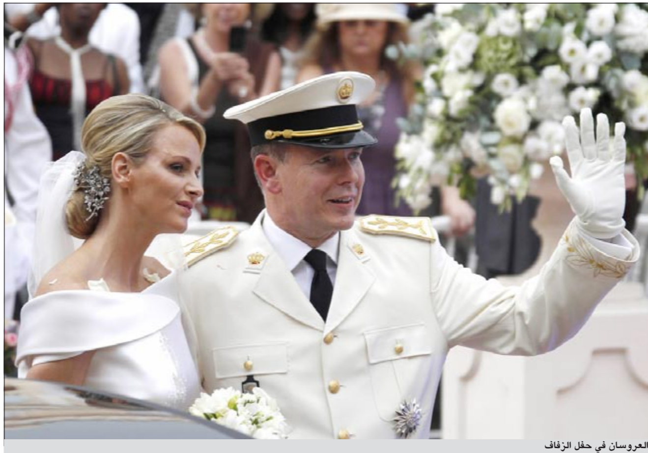
العروسان في حفل الزفاف

كانت ترغب في «الفرار» قبل حفل زفافها على الأمير. أقام الأمير البير وعروسه في موطنها بجنوب أفريقيا حفل زفاف أمس الخميس في دربان بعد زفافهما الكبير الذي أقيم مطلع الأسبوع في موناكو.