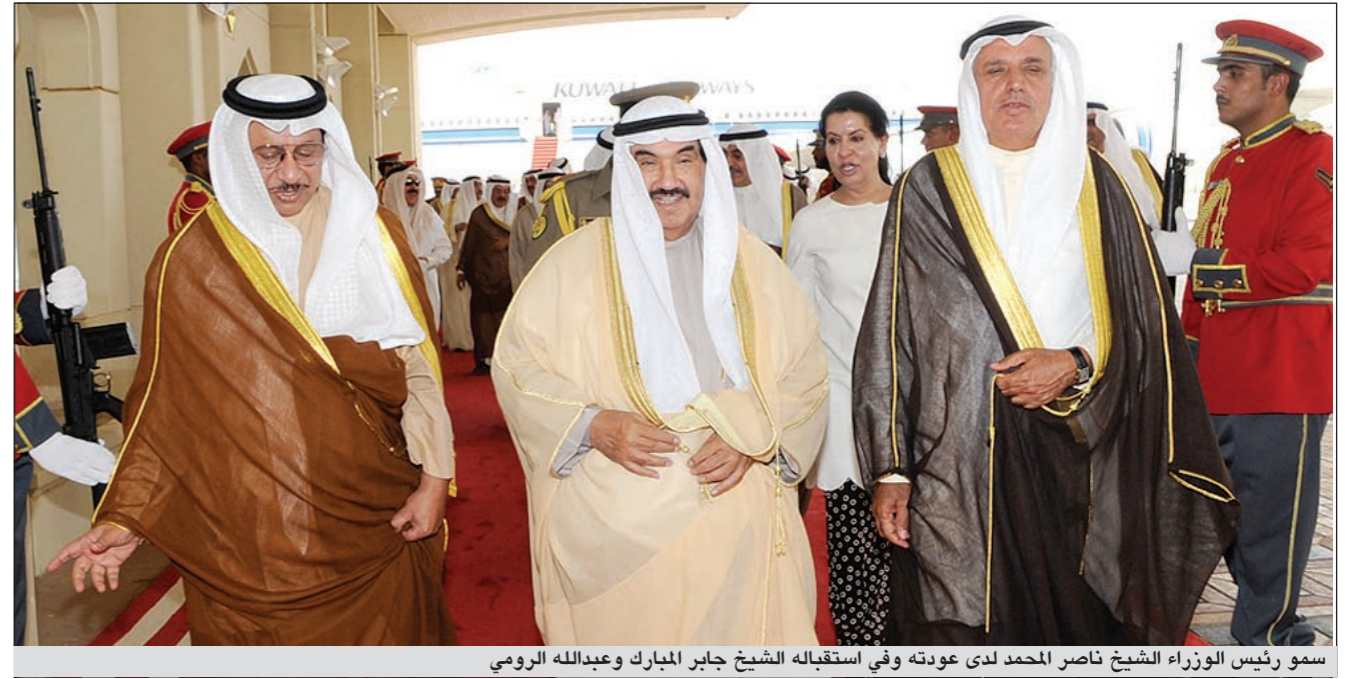
سمو رئيس الوزراء ناصر المحمد لدى عودته وفي استقباله الشيخ جابر المبارك وعبدالله الرومي

زيارة رسمية لمملكة البحرين الشقيقة استغرقت يومين وكانت محطته الخامسة والأخيرة ضمن جولته في دول مجلس التعاون لدول الخليج العربية الشقيقة التي بدأها يوم الاثنين الماضي. وكان في مقدمة مودعي سموه والوفد المرافق له في مطار البحرين الدولي رئيس وزراء مملكة البحرين الشقيقة صاحب السمو الملكي الأمير خليفة بن سلمان آل خليفة ونائب رئيس الوزراء رئيس بعثة الشرف سمو الشيخ علي بن خليفة آل خليفة وأعضاء الحكومة وكبار رجالات المملكة وسفيرنا لدى مملكة البحرين الشيخ عزام الصباح وأعضاء السفارة.