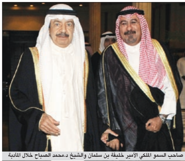
صاحب السمو الملكي الأمير خليفة بن سلمان والشيخ د.محمد الصباح خلال المأدبة

«البلاد» في افتتاحيتها «لم يكن اللقاء الذي جمع رئيس الوزراء صاحب السمو الملكي الأمير خليفة بن سلمان آل خليفة وسمو رئيس مجلس الوزراء الشيخ ناصر المحمد على أرض مملكة البحرين إلا حلقة إضافية من شأنها تعزيز علاقات البلدين الشقيقين في إطار منظومة أرقى وأسمى نجحت عبر السنين في أن تثبت أنها الإطار الإقليمي الأكثر عمقا وصمودا أمام عدد من التحديات ألا وهي مجلس التعاون الخليجي». وأضافت «على هذه الأرضية السياسية جاء اللقاء الذي عكس حفاوة بالغة بضيف البلاد الكريم.. حفاوة تخطت الشكل والبروتوكول وكان لها التأثير الأقوى في تأكيد الجانبين على أهمية تعزيز التعاون الثنائي بل وحتمية رفض أي تدخلات في الشؤون الداخلية لدول المجلس». وتابعت الصحيفة قائلة «فما مر على مملكة البحرين من أحداث مؤسفة يجب أن يكون عبء