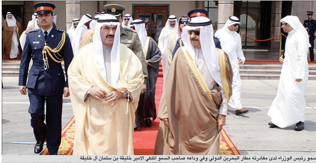
سمو رئيس الوزراء لدى مغادرته مطار البحرين الدولي وفي وداعه صاحب السمو الملكي الأمير خليفة بن سلمان آل خليفة