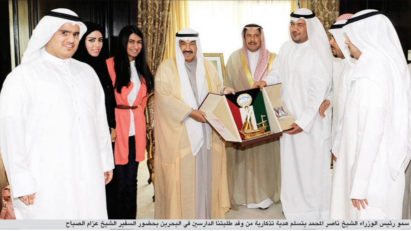
سمو رئيس الوزراء الشيخ ناصر المحمد يتسلم هدية تذكارية من وفد طلبتنا الدارسين في البحرين بحضور السفير الشيخ عزام الصباح