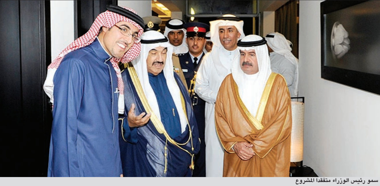
سمو رئيس الوزراء متفقدًا المشروع

المنامة - كونا: قام سمو رئيس مجلس الوزراء الشيخ ناصر المحمد خلال زيارته لمملكة البحرين الشقيقة بإرفقه نائب رئيس مجلس الوزراء في المملكة ورئيس بعثة الشرف المرافقة سمو الشيخ علي بن خليفة آل خليفة بزيارة تفقدية لمشروع «درة البحرين» الذي يقع في المنطقة الجنوبية من المملكة. واستمع سموه والوفد المرافق خلال زيارته الى شرح تفصيلي عن المشروع من رئيس مجلس ادارة «شركة درة البحرين» والعضو المنتدب في بيت التمويل الكويتي - البحرين عبدالكريم الخياط الذي بين ان المشروع من أهم وابرز المشاريع في المحافظة الاستثمارية لبيت التمويل الكويتي - البحرين. وأوضح الخياط ان المشروع هو اكبر مشروع عقاري سكني وتجاري وترفيهي وسياحي يقام في مملكة البحرين اذ تقوم على تطويره «شركة درة خليج