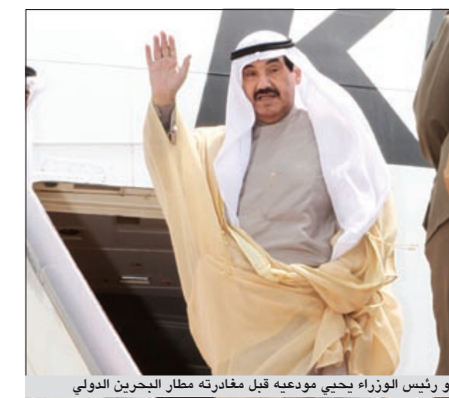
سمو رئيس الوزراء يحيى مودعيه قبل مغادرته مطار البحرين الدولي

عاد إلى البلاد سمو الشيخ ناصر المحمد رئيس مجلس الوزراء والوفد الرسمي المرافق لسموه بعد زيارة رسمية لدول مجلس التعاون لدول الخليج العربية. وكان في مقدمة مستقبلي سموه على أرض مطار الكويت عبدالله الرومي والنائب الأول لرئيس مجلس الوزراء وزير الدفاع الشيخ جابر المبارك ونائب رئيس مجلس الوزراء وزير العمل والشؤون الاجتماعية والعمل د. محمد العفاسي وعدد من الشيوخ والوزراء والمحافظين وكبار قادة الجيش والشرطة والحرس الوطني وكبار المسؤولين