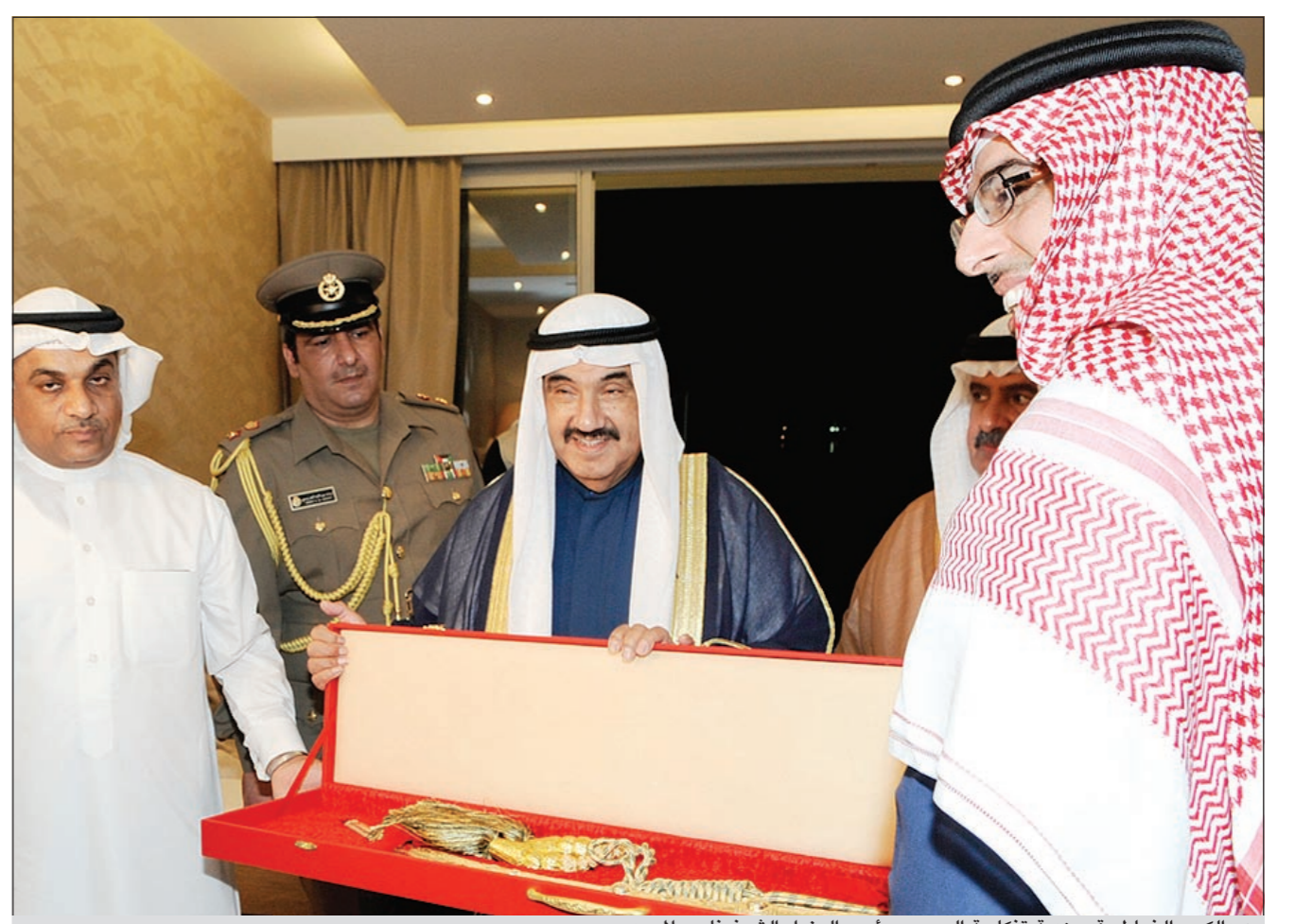
عبدالكريم الخياط يقدم هدية تذكارية إلى سمو رئيس الوزراء الشيخ ناصر المحمد