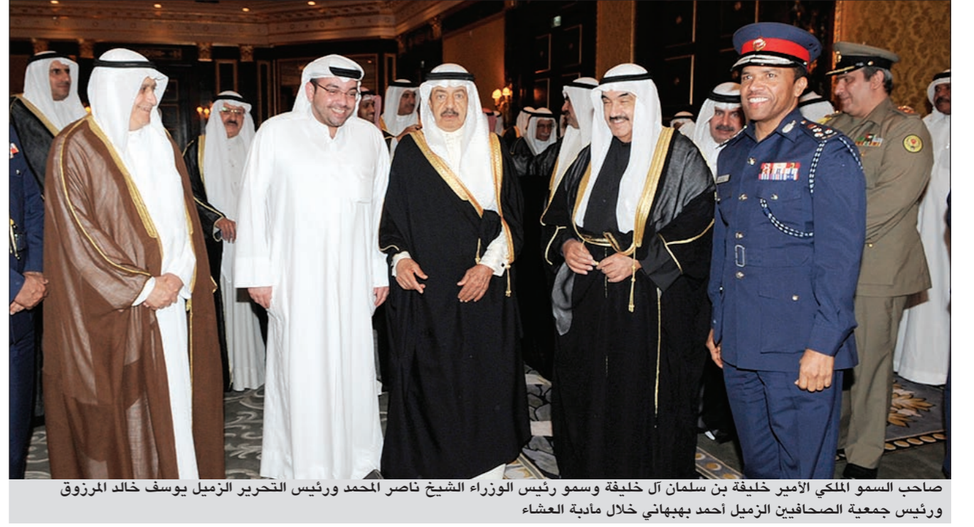
صاحب السمو الملكي الأمير خليفة بن سلمان آل خليفة وسمو رئيس الوزراء الشيخ ناصر المحمد ورئيس التحرير الزميل يوسف خالد المرزوق ورئيس جمعية الصحافيين الزميل أحمد بهجاني خلال مأدبة العشاء

فالمخاطر المحددة بالمنطقة لا تعرف حدودا بين دولة وأخرى والخطر الذي تخمله لا يفرق بين شعب وآخر لذلك فإن التصدي لها يجب أن يكون طابعه تكامليا من أجل حماية الحقوق وتعزيز المكتسبات.. ومن جانبها أبرزت صفح «أخبار الخليج» و«الأيام» و«الوسط» و«الوطن» خبر الزيارة ولقاء سمو رئيس مجلس الوزراء بعاهل مملكة البحرين وسمو رئيس وزراء مملكة البحرين وقالت أن «الجانبين بحثا سبل تنمية العلاقات الثنائية بين البلدين الشقيقين ودعم مسيرة مجلس التعاون والقضايا الإقليمية والعربية الراهنة وتطورات الأحداث على المستويين الخليجي والعربي». وأشارت الصحف البحرينية إلى دعوة سمو رئيس مجلس الوزراء ورئيس وزراء مملكة البحرين بين الجانبين إلى عقد اجتماعات دورية لرؤساء الحكومات بدول مجلس التعاون.