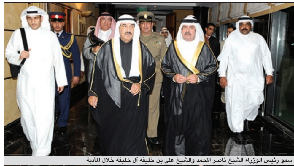
سمو رئيس الوزراء الشيخ ناصر المحمد والشيخ علي بن خليفة آل خليفة خلال المأدبة

المحمد بن عيسى آل خليفة ورئيس الوزراء الأمير خليفة بن سلمان آل خليفة الأولى لجميع الصحف البحرينية كما تناولت الصحف في افتتاحياتها تحليلات لأثر الزيارة ونتائجها وما تعنيه من توثيق الروابط الأخوية لكل من دولة الكويت ومملكة البحرين. ومن جهتها قالت صحيفة