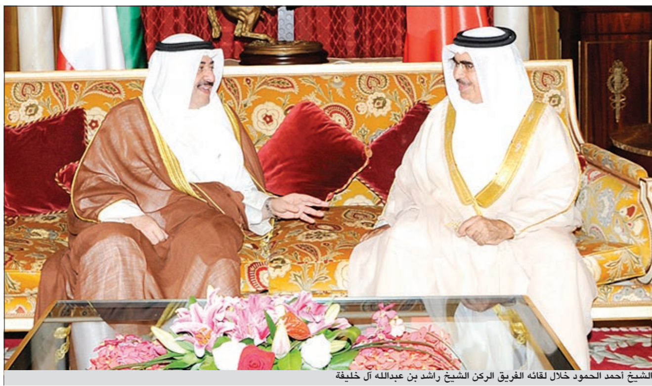
الشيخ أحمد الحمود خلال لقائه الفريق الركن الشيخ راشد بن عبدالله آل خليفة

البحرين والمتمثلة في حوار التوافق الوطني الذي أطلقه عاهل البحرين الملك حمد بن عيسى آل خليفة وبمبادرة جلالته إلى بحث كافة بتشكيل اللجنة الملكية المستقلة لتقصي الحقائق. وأشاد الشيخ أحمد الحمود بالسلمة المتميز للعلاقات بين البلدين في المجالات الأمنية وأن هذا التعاون يثري مسيرة التعامل الأمني الخليجي في إطار تمتين العلاقات الأخوية التي تربط بين البلدين الشقيقين وما يجمعهما من روابط تاريخية ووحدة المصير والهدف. متمنيا لمملكة البحرين مزيدا من التقدم والازدهار ودوام الأمن والاستقرار في ظل قيادة صاحب الجلالة الملك حمد بن عيسى آل خليفة وبجهود صاحب السمو الملكي رئيس الوزراء الشيخ خليفة بن سلمان آل الصباح وبدعم ومساندة ولي العهد ونائب القائد الأعلى صاحب السمو الملكي الأمير سلمان بن حمد. وقد تم خلال اللقاء التباحث