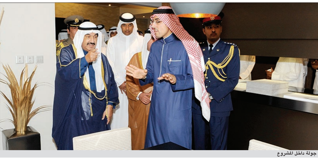
جولة داخل المشروع