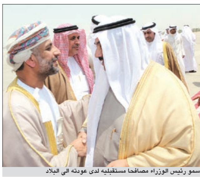
سمو رئيس الوزراء مصافحا مستقبليه لدى عودته إلى البلاد

بديوان سمو رئيس مجلس الوزراء وأعرب سمو رئيس مجلس امتنانه لقادة دول مجلس التعاون لدول الخليج العربية للحفاوة والاستقبال الحار الذي حظي به سموه والوفد المرافق خلال جولته الرسمية الخليجية. وقال سموه في تصريح له «كونا» لدى عودته إلى البلاد أن لقاءاته مع أصحاب الجلالة والسمو تأتي في إطار الحرص على التشاور والتنسيق مع الأشقاء حول كل ما يهم دولنا ويحقق مصالح أبناء دول المجلس. وثمن سموه ما لقيه من