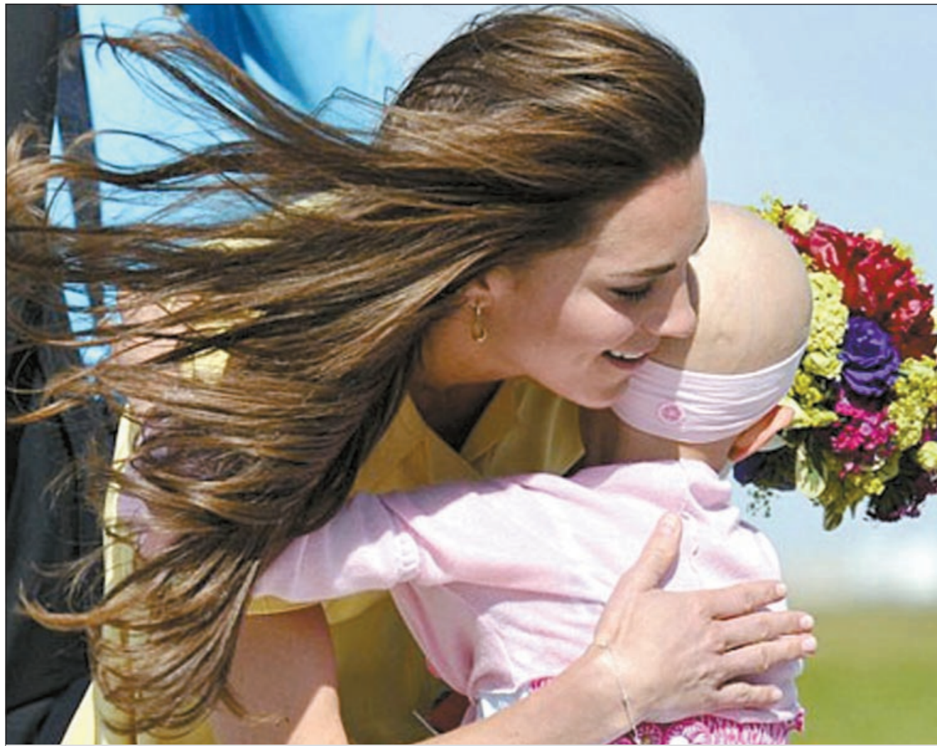
كيت تحتضن بحنان بالغ الطفلة المصابة بالسرطان