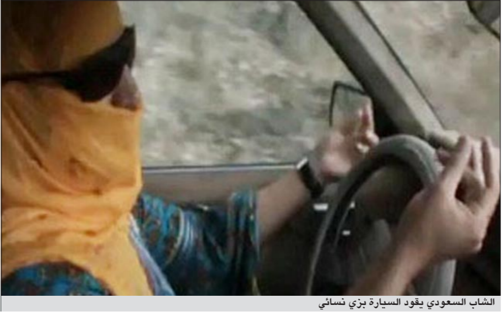
الشاب السعودي يقود السيارة بزى نسائي