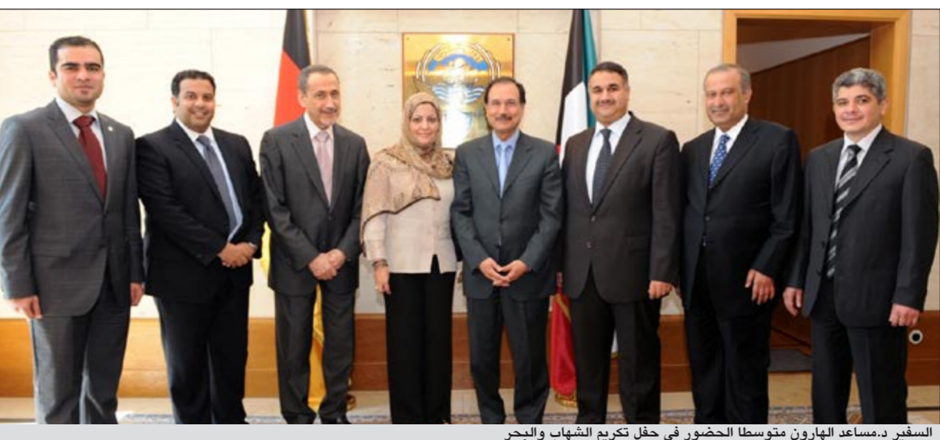
السفير د.مسعود الهارون متوسلا بحضور في حفل تكريم الشهاب والبحر

وفيما يتعلق بانتقاله للعمل في السفارة الكويتية لدى كوريا الجنوبية أعرب الديبلوماسي الكويتي عن اعتقاده بأن العمل الديبلوماسي في سيول سيكون مختلفا عن العمل في برلين وذلك بحكم اختلاف الثقافتين الألمانية