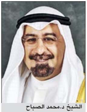
الشيخ د.محمد الصباح