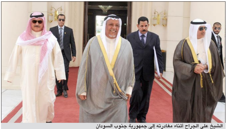
الشيخ علي الجراح أثناء مغادرته إلى جمهورية جنوب السودان

غادر ممثل صاحب السمو الأمير الشيخ صباح الأحمد، حفظه الله ورعاه، نائب وزير شؤون الديوان الأميري الشيخ علي الجراح البلاد، متوجها إلى جمهورية جنوب السودان وذلك لحضور مراسم احتفال استقلال جمهورية جنوب السودان.