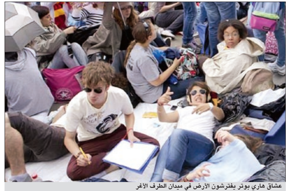
عشاق هاري بوتر يفترشون الأرض في ميدان الطرف الأغر

لندن - أ.ش.أ: تجمع عدد كبير من الشباب البريطاني في ميدان الطرف الأغر اول من امس لقمضوا ليلتهم هناك انتظارا لبدء عرض الجزء الأخير من فيلم هاري بوتر بطولة النجم دانييل رادكليف. ويتكون الجمع من عدد من المراهقين والذين كبروا مع أجزاء الفيلم المختلفة في الميدان ومعهم مستلزمات مبيت ليلتهم ويرتدي عدد منهم الملابس المميزة لعدد من أبطال الفيلم.