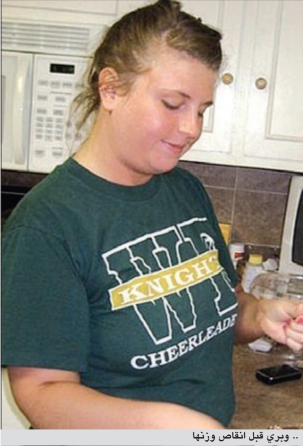
.. ويرى قبل انقاص وزنها