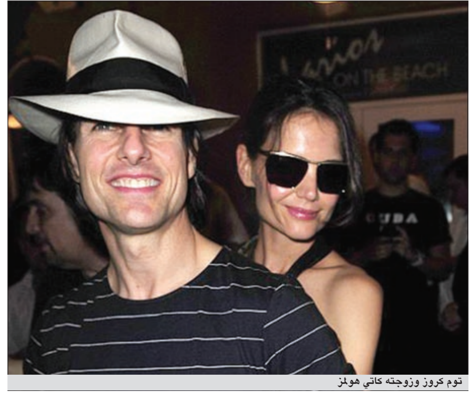
توم كروز وزوجته كاتي هولمز

حؤل النجم توم كروز (49 سنة) احدى غرف الضيوف بقصره، والقريبة من غرفة نومه، الى غرفة شخير حتى لا يزعج زوجته كاتي هولمز (32 سنة) وابنته سوري (5 سنوات). وبحسب تقارير صحافية، قال سمسار عقارات انه ظن ان الامر قد يكون اجراء مؤقتا، ولكن بمجرد معرفة الامر طلب العديد بناء غرف شخير بمنزلهم، مضيفا ان السر هو جعل الغرفة