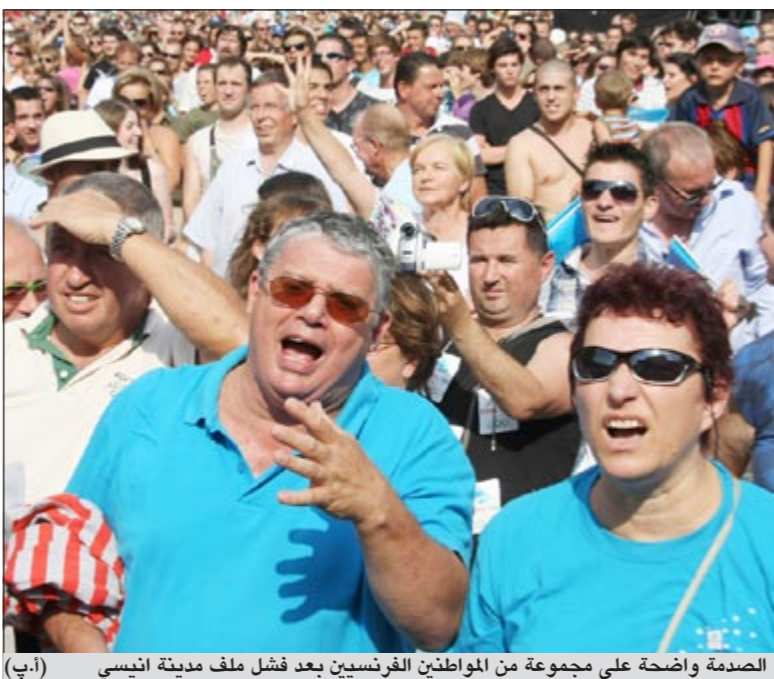
الصدمة واضحة على مجموعة من المواطنين الفرنسيين بعد فشل ملف مدينة انيس