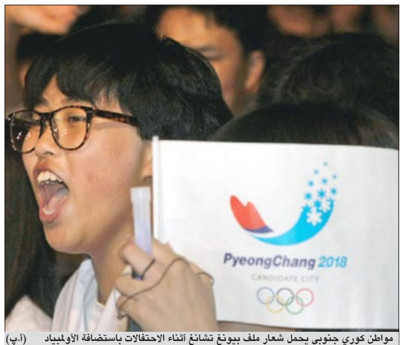
مواطن كوري جنوبي يحمل شعار ملف بيونغ تشانغ أثناء الاحتفالات باستضافة الأولمبياد