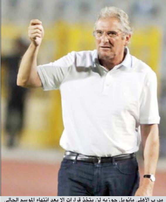
مدرب الأهلي مانويل جوزيه لن يتخذ قرارات إلا بعد انتهاء الموسم الحالي

أكد البرتغالي مانويل جوزيه المدير الفني لفريق كرة القدم بالنادي الأهلي أن قرارات التجديد والتعاقدات سيتم بحثها عقب نهاية بطولة الدوري وفي حال إصرار أي لاعب على الرحيل نحترم قراره ونوجه له الشكر على الفترة التي قضاها داخل النادي ومساعدته للفريق. وأضاف قائلا «اتخذت قراراتي وأعلم من سيرحل ومن سيبقى وإدارة النادي تعلم هذه القرارات ومن الممكن أن نتناقش وتغير رأينا حول لاعب أو آخر لكن كل هذا في نهاية الموسم». وعن مفاوضات أحمد حسن مع الزمالك قال جوزيه انه لا يتخذ قرارات التجديد من عدمه إلا قبل نهاية الموسم، وبعدها يتم تحديد الاحتجاجات من اللاعبين الجدد وتجديد تعاقد البعض. وتشير الأبحاث داخل الأهلي إلى قرب رحيل أحمد حسن وسيد معوض وأسامة حسني ومحمد فضل وفرانسيس، إضافة إلى عدم عودة كل المعارين للأندية الأخرى. وأضاف: عندما حضرت إلى القاهرة لقيادة الأهلي جئت قبلي ومشاغري دون أدنى ترد لأنتي أحب هذا النادي وأريد مساعدته، مضيفاً: عند عودتي لم يطالبني رئيس النادي بتحقيق البطولات بقدر مطالبته بتكوين فريق للمستقبل، لكنني أخبرته أننا سنحقق البطولة بجانب تكوين فريق جديد وشاب، وسأظل مديراً فنياً للأهلي مادامت الجماهير تحتاج تواجدني على رأس القيادة الفنية ولا أقتعل المشاكل لأنني يجب أن أحل أي مشكلة تواجه فريقنا». وتابع «حضرت لقيادة الأهلي وسأعتزل هنا وأنا أحقق البطولات، وسأدرب هذه الفريق حتى يرحل رئيس النادي عن الإدارة الحمراء، البعض يريد أن يوقف مسيرة الفريق، ولن ننظر إلى عدد قليل من الجماهير مهاجمنا مجرد أننا نحقق الانتصارات والألقاب، وعلى جماهير الأهلي الحقيقية أن تظهر في هذه الأوقات».