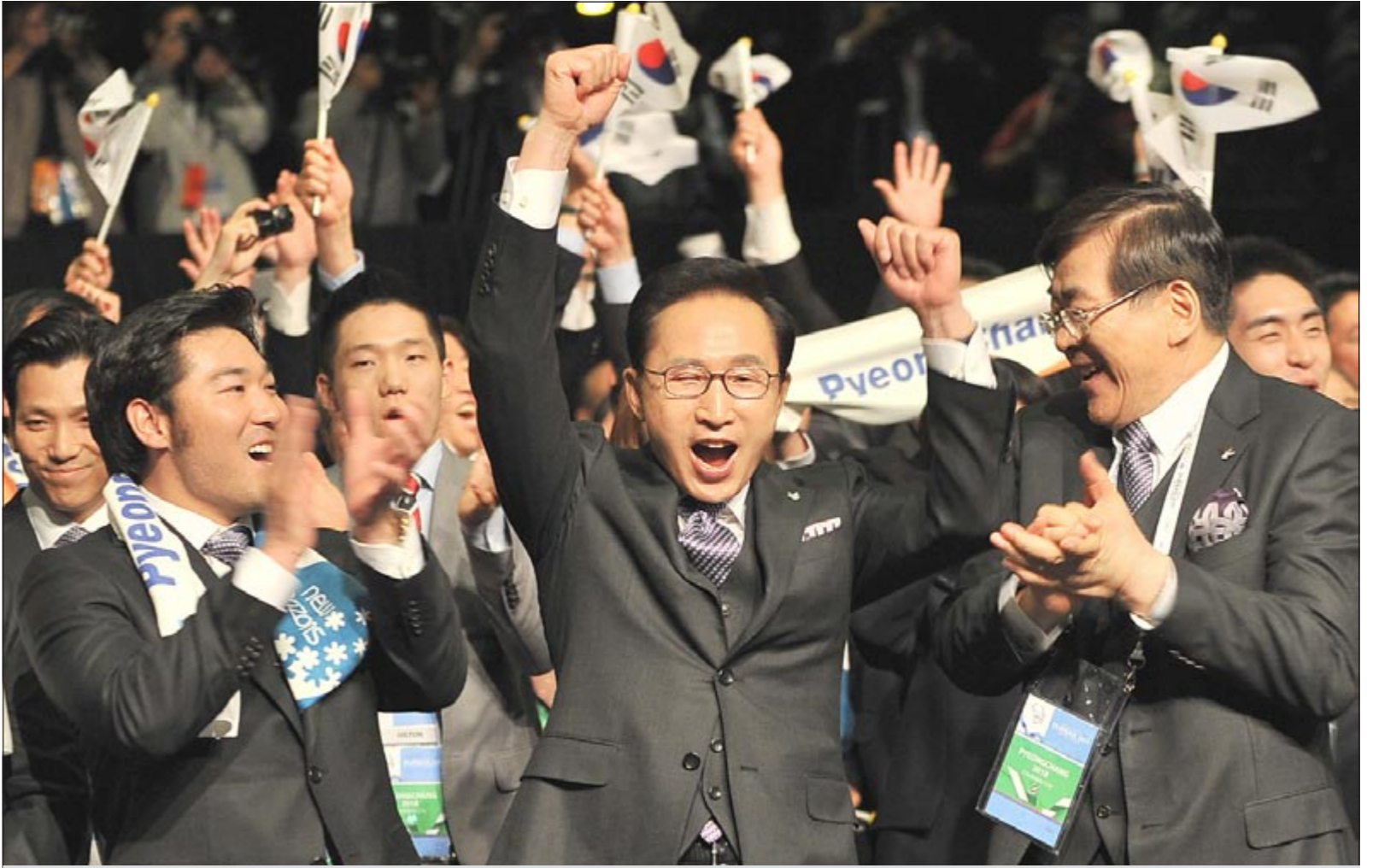
الرئيس الكوري الجنوبي لي ميونغ باك يقفز فرحاً لحظة إعلان فوز ملف «بيونغ تشانغ»

باخ معلقاً على ملف ميونخ الذي اعتبر إلى حد كبير المنافس الأقوى لبيونغ تشانغ أن أعضاء اللجنة الأولمبية الدولية كان عليهم الاختيار ما بين تدعيم الكورية الجنوبية لاستضافة دورة الألعاب الأولمبية الشتوية لعام 2018.