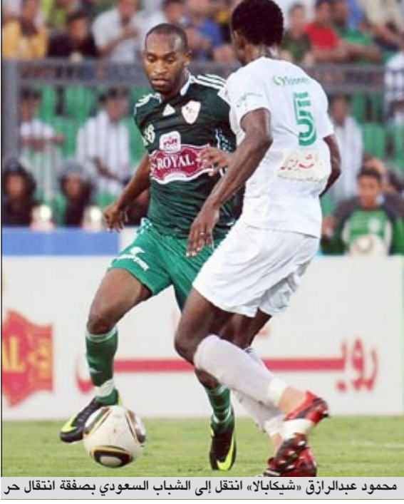
محمود عبدالرازق «شيكابالا» انتقل إلى الشباب السعودي بصفقة انتقال حرق

أعلن نادي الشباب السعودي عن إتمام صفقة انتقال لاعب نادي الزمالك المصري محمود عبدالرازق «شيكابالا» إلى صفوف الفريق بداية من يناير المقبل بعقد يمتد سنتين ونصف السنة مقابل 3,5 ملايين يورو. وبحسب موقع نادي الشباب على شبكة الإنترنت فمن المقرر في الوقت الحالي الإعداد للإعلان عن تفاصيل التعاقد في مؤتمر صحفي خلال الأيام القليلة المقبلة خاصة أن اللاعب أصبح حراً بانتهاء عقده مع الزمالك هذا الموسم. وكان رئيس نادي الشباب خالد البطان أعلن في وقت سابق عن انتهاء الصفقة بشكل رسمي وأن ما تبقى هي مجرد رتوش صغيرة في بنود التعاقد وأن الإعلان عن إتمام الصفقة هو مسألة وقت. يذكر أن شيكابالا سيحمل شعار الشباب بداية من الموسم المقبل في صفقة انتقال حر بعد انتهاء عقده مع الزمالك ولن يكون لناديه السابق أي مقابل مادي. علماً بأنه موقوف أيضاً في آخر مباراتين في البطولة المحلية التي تنتهي بنهايتها.