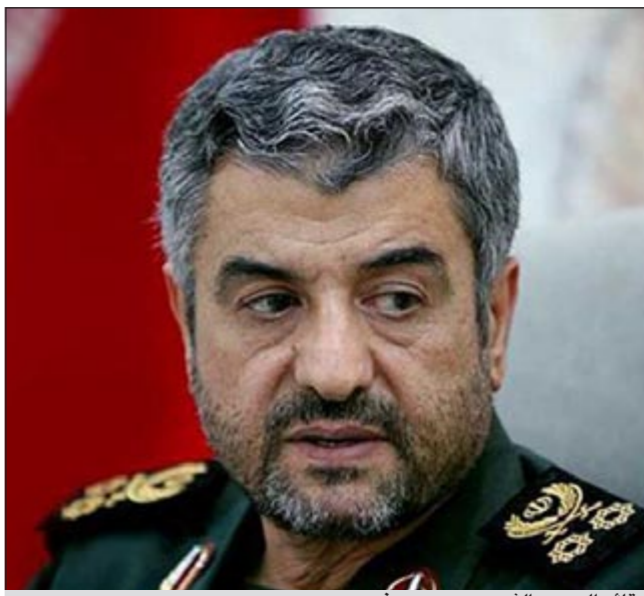
قائد الحرس الثوري محمد جعفري

إلى ذلك، أعربت صحيفة «كيبان» التابعة للمرشد الأعلى في الجمهورية الإسلامية في إيران علي خامنئي عن مخاوفها من حرب التسريبات الأخيرة التي قام بها بعض أنصار المرشد والرئيس أحمدني نجاد، وقالت إن هذه التسريبات تقوي العدو، الذي يستغل عدداً من