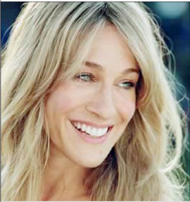
سارا جيسكا باركر

لوس انجيليس -إيلاف: وفقاً لمجلة «فوربس»، تصدرت النجمتان، سارا جيسكا باركر وأنجيلينا جولي، قائمة أكثر النجمات ربحاً للمال في العام الماضي، محققة كل منهما عائداً مادياً قدر بـ 30 مليون دولار.