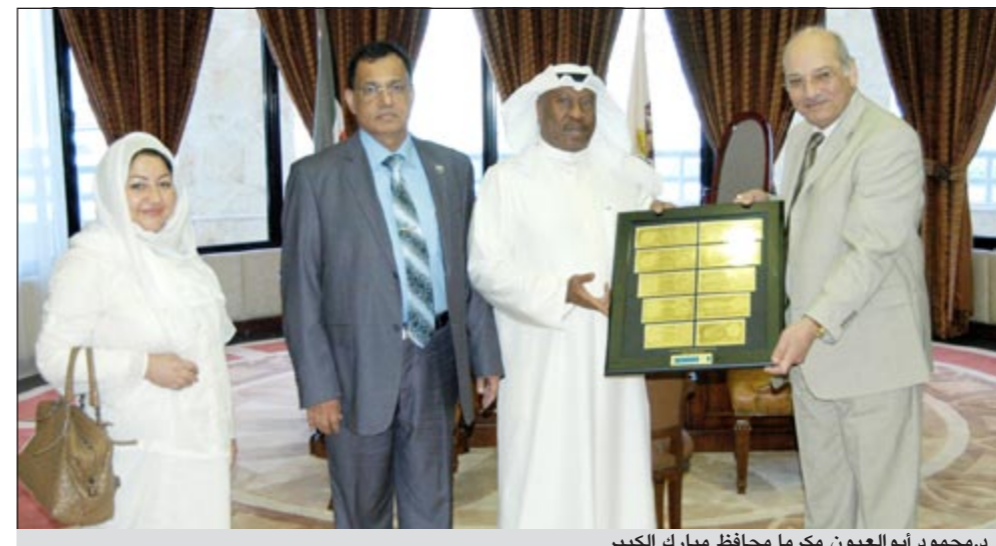
د.محمود أبو العيون مكرما محافظ مبارك الكبير

كما قدم الفريق للمحافظ كذلك شرحاً عن آخر الخدمات والمنتجات المصرفية والاستثمارية التي تقدم للعملاء والمتوافقة مع أحكام الشريعة الإسلامية، بالإضافة إلى الخدمات المصرفية التجارية والتي منها المراجعات بأنواعها والوكالة في الاستثمار.