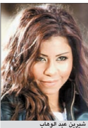
شيرين عبد الوهاب

كشفت الفنانة شيرين عبد الوهاب عن أن الأمومة جعلتها أكثر هدوءا، وقالت شيرين لمجلة «لها» الصادرة هذا الأسبوع: «الأمومة تمنح المرء كمية أكبر من الحنان والتسامح، وحقيقة أشعر بانى صرت أكثر هدوءا وروصانة». وأضافت: «لا أزال صريحة كما عرفني الناس، وأقول ما أحس به، في السابق كان قلبي يركنى، لهذا كنت تجدني أكثر انفعالية، ومن يقول عني كلمة كنت أزد عليه بعشر كلمات، أما اليوم فصرت أفكر قبل الكلام وأحكم عقلي وقلبي في وقت واحد». وعن الصلح بينها وبين أصالة، قالت شيرين: «شعرت بأنه يجب أن نضع خلافاتنا جانبا عندما يتعلق الأمر بالفرح والحزن أيضا لا سمح الله، ولقد زرتها وهنأتها بعد إنجابها التوأمين، وهذا واجبى والكل فرح لها، وبالتأكيد لم تكن الوحيدة التي شاركتها هذه الفرحة، بل علمت أن أمين عبدالحى يعمل والده موظفا سميعة سعيد زارتها، وكذلك أنغام، وغيرهما كثيرات وكثيرون».