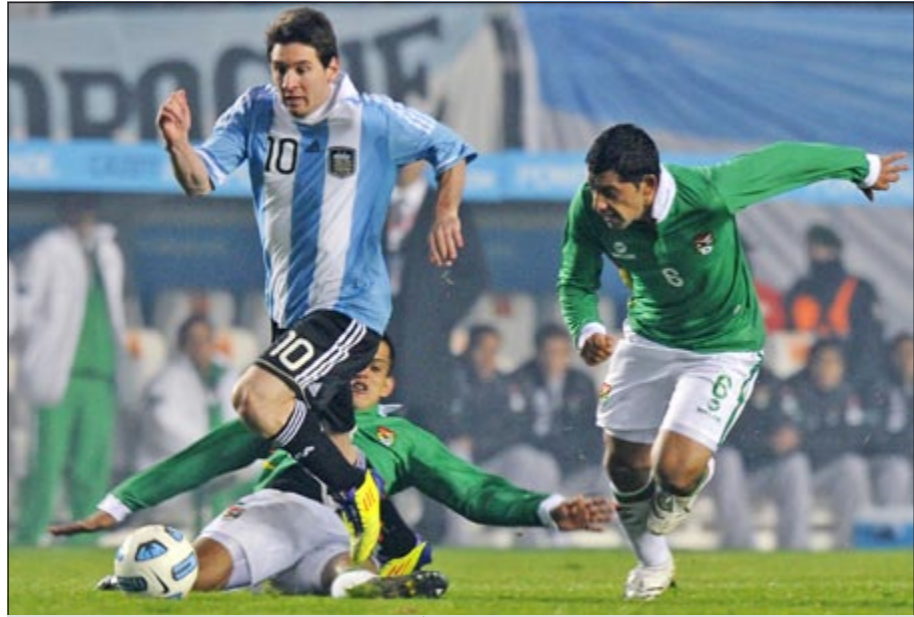
مهاجم الأرجنتين ليونيل ميسي فشل في التهديف أمام بوليفيا في المباراة السابقة

على التوالي. وستركز الأضواء مجددا على نجم برشلونة الإسباني ليونيل ميسي أفضل لاعب في العالم في آخر موسمين، الذي يدهش العالم مع فريقه الكاتالوني ولم يتوصل حتى الآن في سحب هيمته مع فريقه إلى المنتخب الوطني المتعطلش للالقب.