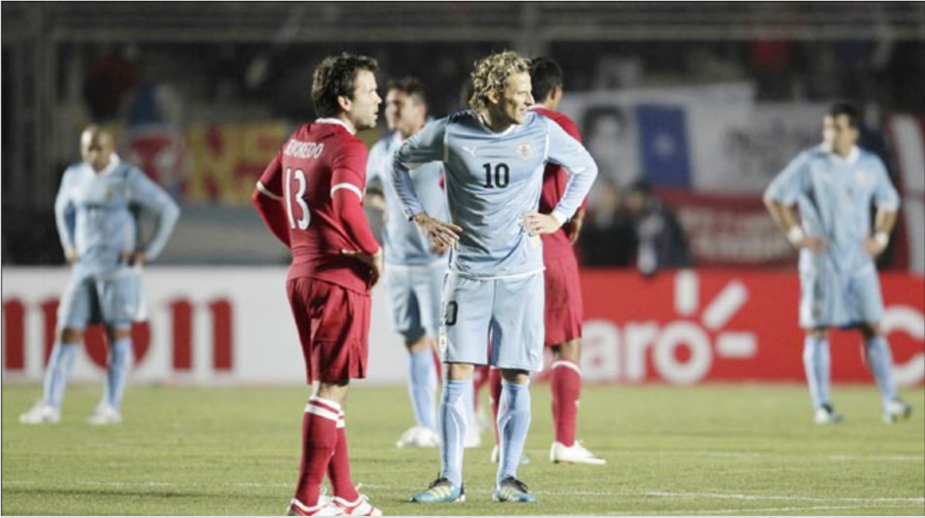
مهاجم أوروغواي دييغو فورلان غاضب من نتيجة التعادل أمام بيرو