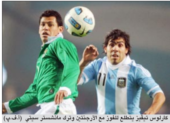
كارلوس تيفيز يتطلع للفوز مع الأرجنتين وترك مانشستر سيتي

اعلن مهاجم منتخب الأرجنتين كارلوس تيفيز انه يريد ترك ناديه مانشستر سيتي الإنجليزي لأسباب عائلية في بيان رسمي، واعتبر تيفيز انه لا يستطيع العيش في شمال إنجلترا بعيداً عن ابنتيه، وجاء في البيان «اريد ان اكون اقرب اليهما وان اقضي وقتاً أطول معهما»، وأضاف «العيش في مانشستر من دونهما كان تحدياً كبيراً بالنسبة لي، فكل شيء اقوم به من أجل ابنتي الاثنتين»، وتابع «اريدهما ان تكونا سعيدتين وبالتالي اريد ان اكون في مكان يتأقلمان فيه، وأمل من الناس ان تفهم الظروف الصعبة التي عشتها في الشهر الـ 12 الاخيرة فيما يتعلق بعائلتي»، وأضاف البيان «اعلن وبأسف كبير انه يجب علي ان اترك نادي مانشستر سيتي، واريد