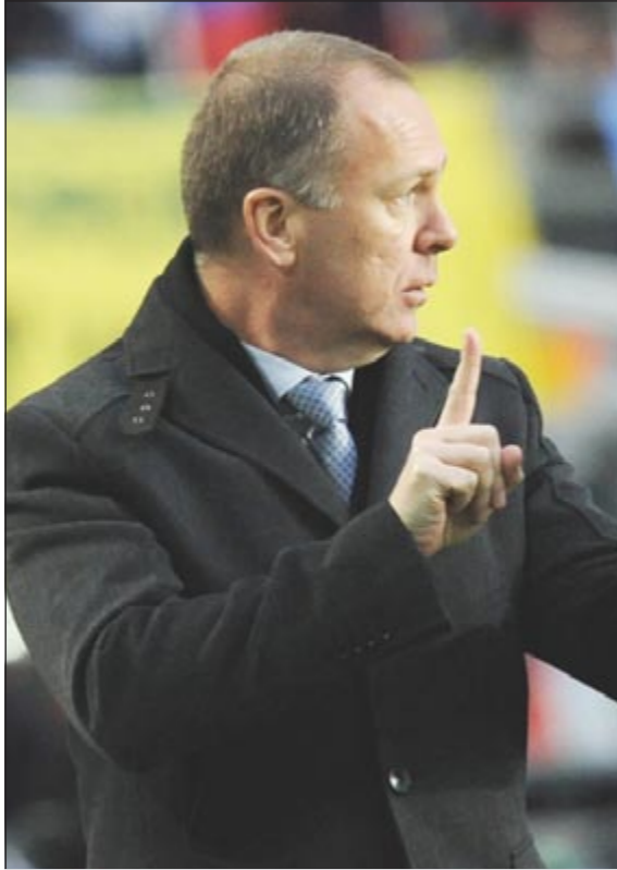
مدرّب البرازيل مانو مينيزيس

أشاد جيراردو مارتينو مدرب پاراغواي بأداء لاعبيه بعد التعادل من دون أهداف مع الاكوادور. وقال الأرجنتيني مارتينو بعد المباراة التي أقيمت في سانتافي «لعبنا أفضل 15 دقيقة في البطولة الحالية حتى الآن وسيكون من الظلم عدم الاعتراف بذلك». وأضاف «إذا وقع الاختيار على مارسيلو بيرازا حارس الاكوادور ليكون أفضل لاعب في المباراة فإن هذا له أسبابه». وشعر مانو مينيزيس مدرب البرازيل بالحزن وهو يشاهد فرحة لاعبي فنزويلا بالتعادل أمام بطل العالم 5 مرات وأكد ان المنافس توقع طريقة لعب فريقه. وقال مينيزيس في مؤتمر صحفي عقب المباراة في لابلاتا «لم ننجح في ان نلعب بالسرعة المطلوبة لانهاء تحركاتنا جيدا وكانت خطوطنا متباعدة جدا». وأضاف «أرسلنا الكثير من الكرات التي داخل منطقة الجزاء عندما لم يكن لدينا أي لاعب للاستفادة منها». وتابع «نحتاج محاولة الوصول الى منطقة الجزاء مع وجود لاعب ينجح في شق طريقه بين قلبى الدفاع». من جانبه، قال سيزار فاريا من مدرب فنزويلا «كانت هناك لحظات كان فيها الفريق يتمتع بالشخصية المناسبة للبحث عن النقاط الـ 3 ومع هذه النتيجة نثق في فرصنا في الوصول الى الدور الثاني».