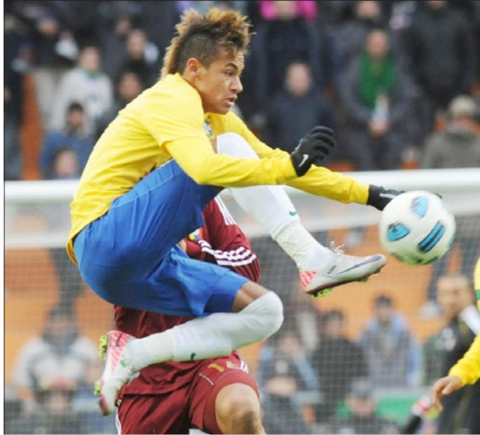
النجم البرازيلي نيمار «يسكن» إحدى الكرات

الشباك دون أن ينجحوا في تمرير الفيش كرة في العمق التي باتو سبغها إليها الحارس الحارص مارسيلو ايليزاغا في (55)، وأرسل ارانغو عرضية مرت فوق رأس زميله روندون واستقرت في أحضان الحارس البرازيلي جوليو سيزار (59)، وسنحت فرصة جديدة للبرازيل بتسديدة أولى من باتو لم تتحمل فوصلت الكرة إلى راميريش وهو على بعد أمتار قليلة فلم تمر من التكتل الدفاعي (62). وكلما مر الوقت كلما ازدادت ثقة الفنزويليين بالنفس وانخفضت لدى البرازيليين الذين اتحت فرصة أخرى بعدما وصلت الكرة إلى فريد بدسل روبينيو داخل المنطقة فارتكب خطأ ضد الدفاع (66). وأنفذ تيغاغو سيلفا حارسه من كرة خطيرة عرضية وصلت إلى ميكو وحولها إلى ركنية (71). وقوت قائد فنزويلا خوان ارانغو فرصة القائد وأرسل الكرة بعيدة عن القائم الأيسر (73).