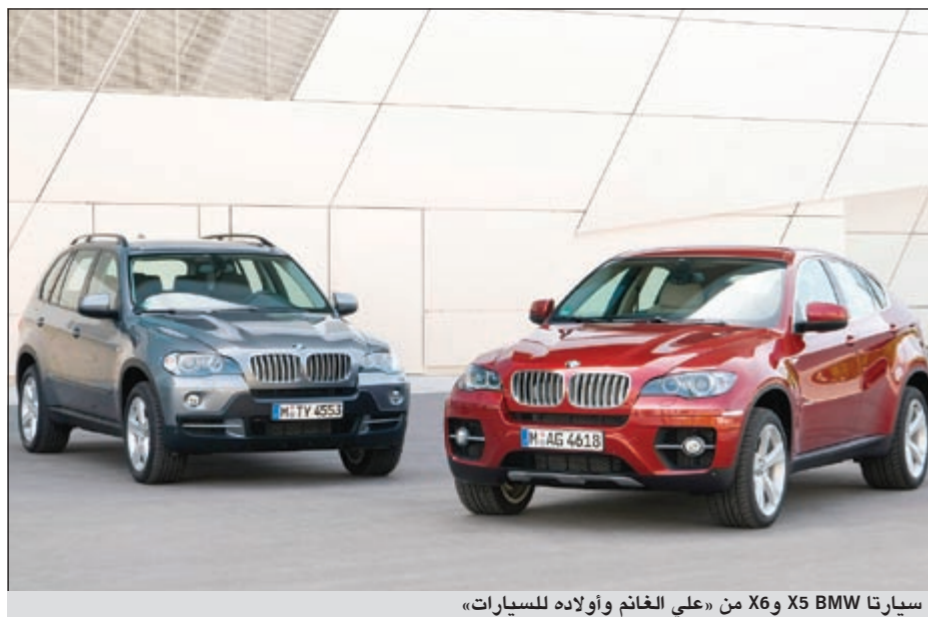
سيارتا BMW X5 وX6 من «علي الغانم وأولاده للسيارات»

في إطار سعيها الدائم لتوفير الأفضل لعملائها، أطلقت شركة علي الغانم وأولاده للسيارات، الوكيل الحصري والموزع المعتمد لمجموعة BMW في الكويت حملة ترويجية خاصة بطرازي X5 أو X6 من BMW.