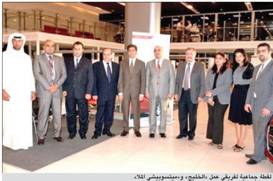
لقطة جماعية لفريقي عمل «الخليج» و«ميتسوبيشي الملا»

بنك الخليج خلال هذا اليوم الخاص لاقتناء أحدث سيارات ميتسوبيشي بأسعار خاصة جداً مع إمكانية الاستفادة من عرض «ولا أحلى..» لغاية 3000 دولار مضمونة في الجيب، والذي يتضمن كذلك العديد من المفاجآت السارة والمزايا الحصرية التي تلبي احتياجات العملاء على جميع المستويات ومختلف الشرائح. وقد أعرب المشاركون بهذه