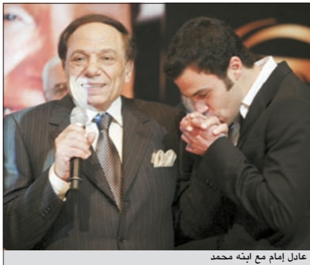
عادل إمام مع ابنه محمد

نفى النجم الكبير عادل إمام الأنباء التي تناولتها العديد من التقارير الصحافية مؤخراً بشأن تسبب نجله محمد إمام في تعطيل أوردات تصوير مسلسل «فرقة ناجي عطا الله»، مشيراً إلى أن السبب في الأزمة كانت إدارة الإنتاج التي أبلغته بمواعيد التصوير بشكل خاطئ أثناء تصوير دوره في فيلم «ساعة ونصف»، وهو ما أدى إلى عدم حضوره. وقال إمام في حوار مع جريدة المصري اليوم: محمد شخص طيب وتحطه على الجرح يبرده، كما يقال، كما أنني قد ربيت أولادي جيداً وغرست فيهم حب المهنة والإخلاص لها وهم يعلمون أن «الشغلانة» صعبة، كما علمتهم ألا يتضايقوا عندما يتعرضون لأي شائهم أو