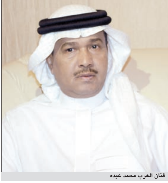
فنان العرب محمد عبده

تردد في أوساط إعلامية أن فنان العرب محمد عبده فاجأ المقربين منه بإعلان ارتباطه رسمياً بفتاة فرنسية من أصول جزائرية تزوج بها أخيراً، وذلك بعد مرور أقل من 3 أشهر على تعرضه لجلطات ثلاث لزم على أثرها أحد المستشفيات العاصمة الفرنسية.