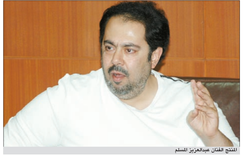
المنتج الفنان عبدالعزيز المسلم

نفسها تحت المسائلة القانونية حتى ولو عرضت أعمالها على شاشات القنوات في شهر رمضان المقبل لأن الرقابة تمتلك الحق