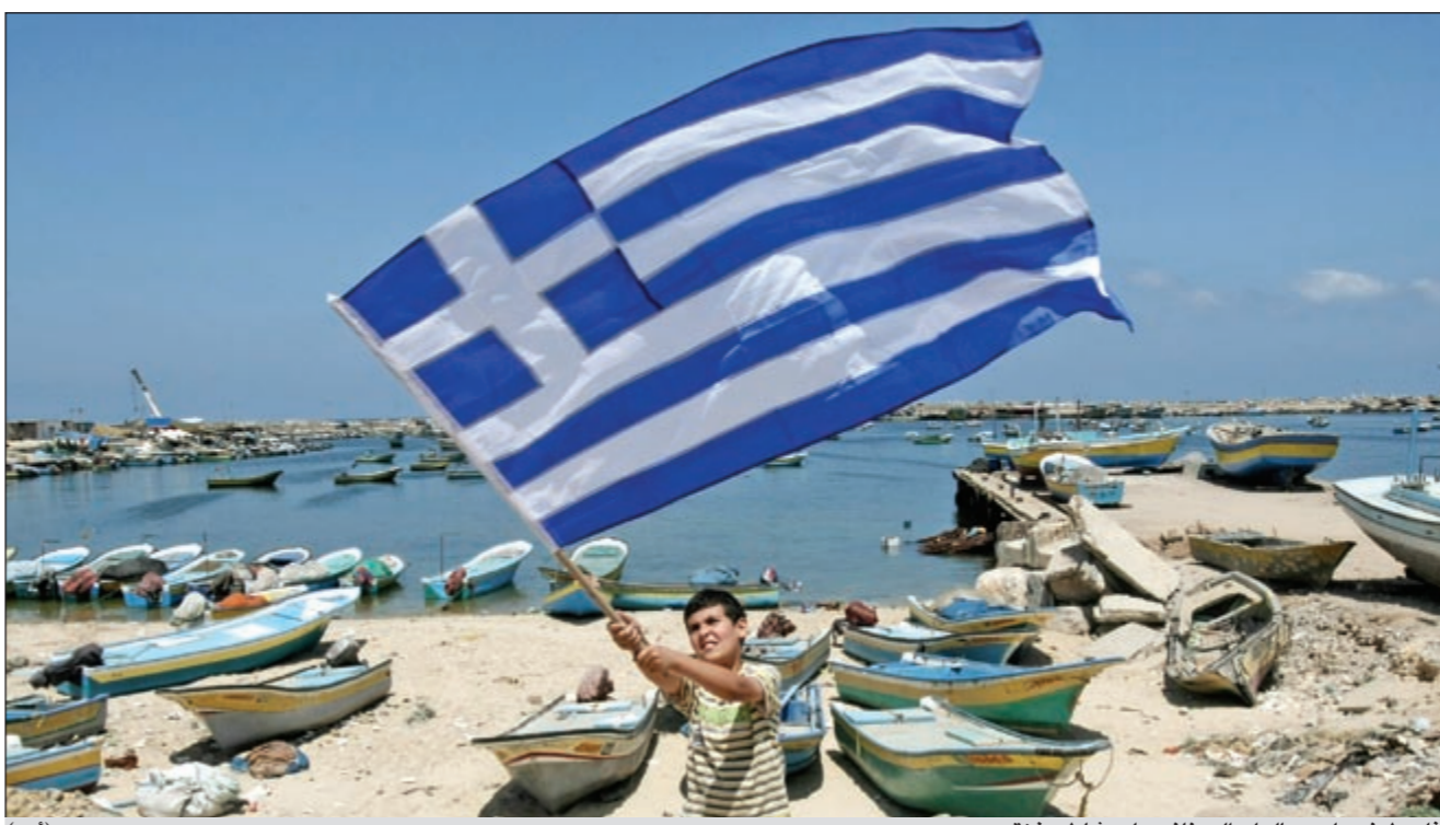
فلسطيني يلوح بالعلم اليوناني على شاطئ غزة (إب)

متنها 36 متضامناً اميركياً، و4 من أفراد الطاقم. وكان منظمو حملة «أسطول الحرية 2» قالوا الخميس ان واحدة من سفنهم تعرضت للتحريب بينما كانت تبحر في المياه الإقليمية التركية. وأوضح المنظمون ان جهاز الدفع في السفينة الايرلندية «ساوريس» تعرض للتحريب بواسطة متفجرات بلاستيكية، وهي ثاني سفينة يتم تحريبها خلال الأسبوع الجاري، وقبل ان يبدأ الأسطول بالتحرك باتجاه قطاع غزة في تحس للخطر البحري المفروض على القطاع