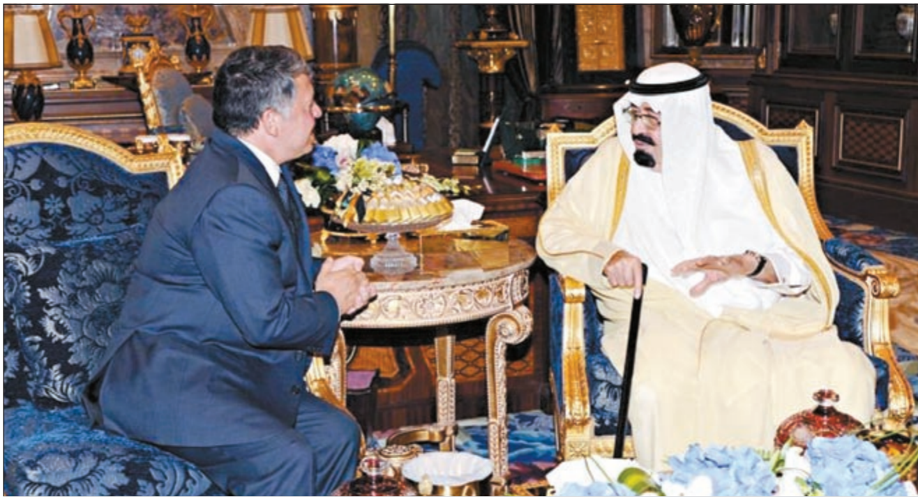
خادم الحرمين الشريفين الملك عبدالله بن عبدالعزيز مستقبلاً العامل الأردني الملك عبدالله الثاني في جدة امس (واس)

وتابعت بيان الملكين «عقدا اجتماعاً معمقاً وشاملاً بحثاً خلاله العلاقات الثنائية بين البلدين وسبل تعزيزها في مختلف المجالات».