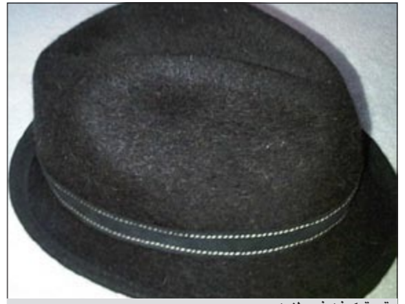
قبعة كيفن فيدرلاين

وأشارت إلى أن كيفن منح جده الضوء الأخضر ليفعل ما يشاء بالأغراض.