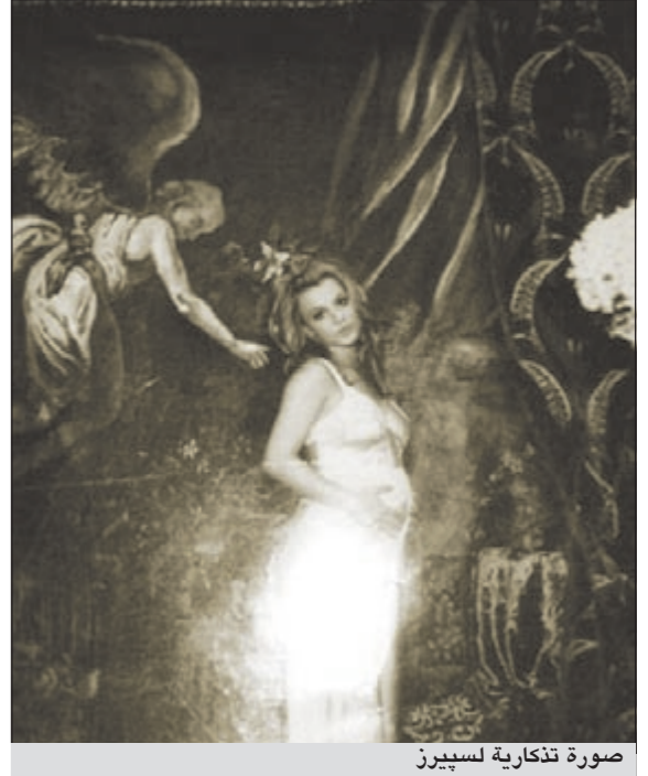
صورة تذكارية لسبيرز

واشنطن - يو.بي.أي: عرض موقع «اي باي» الشهير في مزاد صوراً وبطاقات دعوة تعود إلى أيام كانت فيها النجمة الأميركية بريتي سبيرز وزوجها السابق كيفن فيدرلاين ثنائيا سعيدا.