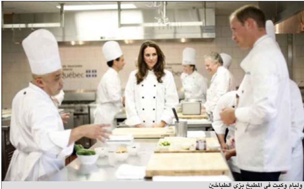
وليام وكيت في المطبخ بيزي الطباخين

بشجاعة كبيرة لتكون بهذه الصراحة، كما أنه لأمر مريح أن نعرف أنها تتقهم ما تمر به أسر الجنود».