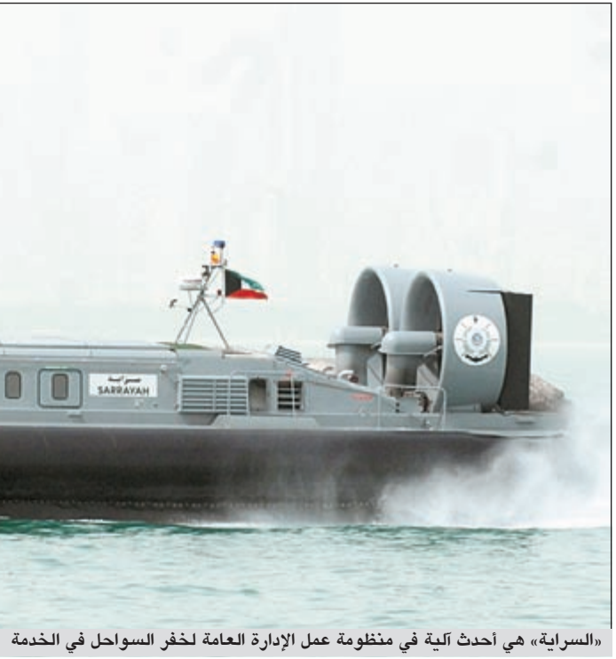
«السراية» هي أحدث آلية في منظومة عمل الإدارة العامة لخفر السواحل في الخدمة

● وضعت الإدارة العامة لخفر السواحل خطة شاملة من خلال تلافى السلبيات وسد الثغرات ومواكبة الأعداد المتزايدة باستمرار لقوارب النزهة والصيد والحد سكي، وذلك من خلال الانتشار