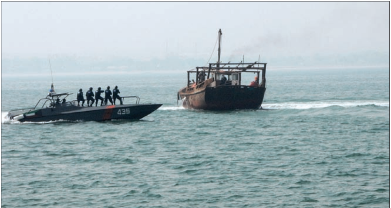
توقيف السفن في عرض البحر له ضوابط ملزمة