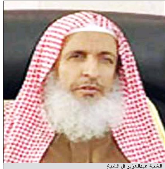
الشيخ عبدالعزيز آل الشيخ

الرياض - وكالات: طالب مفتي عام المملكة رئيس هيئة كبار العلماء الشيخ عبدالعزيز آل الشيخ بالهدوء واللين أثناء إنكار