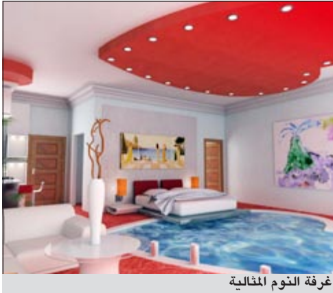
غرفة النوم المثالية

هامبورغ - د.ب.أ: يقول الخبراء إن الفراش الجيد وحده لا يكفي لضمان الشعور بالراحة أثناء النوم.