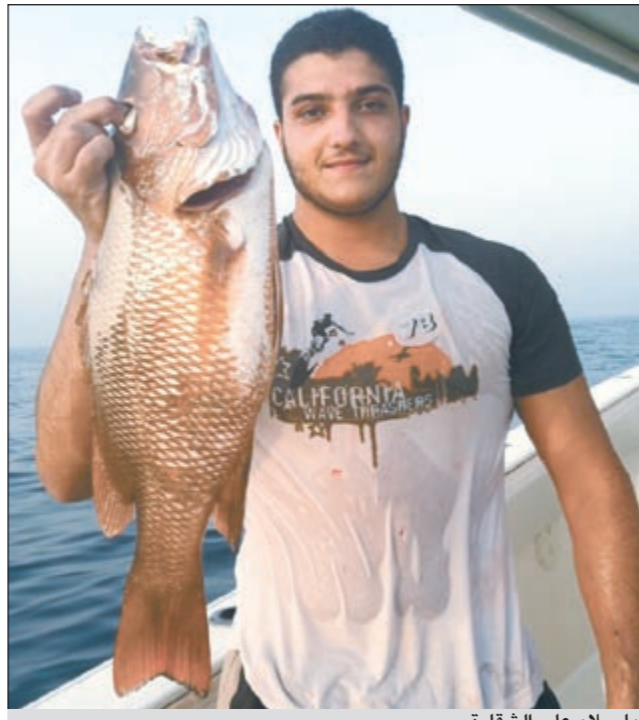
يا سلام على الشقارة