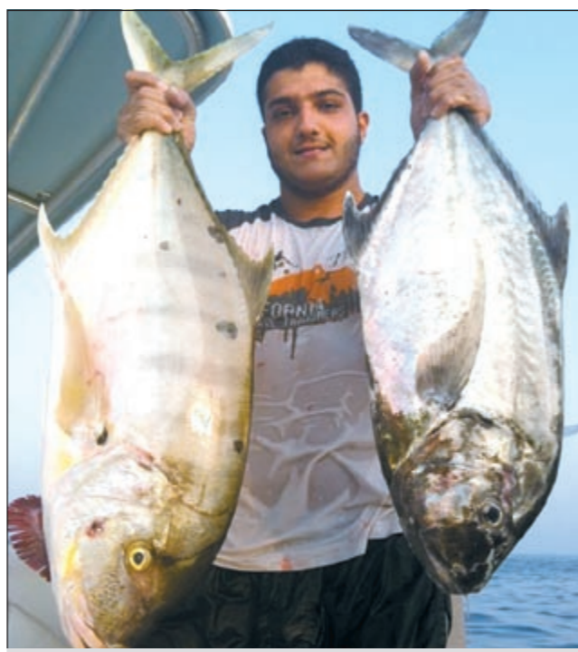
يا عيني على الحمام والربيب

● استخدم في كل رحلاتي البحرية سواء كانت للمحاذق الشمالية او للمحاذق الجنوبية ييم الختاق والربيان وصلاخة المنيد والبراييج.