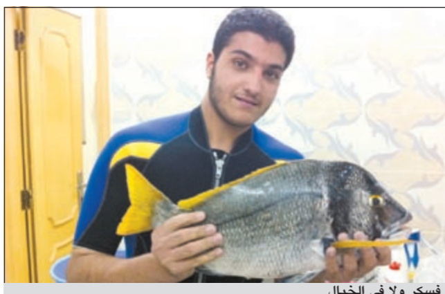
فسكر ولا في الخيال

دعوة تحب أن توجهها والى من؟ ● أولاً أوجه شكري الخاص لجريدة «الانباء» على تخصيصها صفحة أسبوعية تعنى بالبحر والصيد وأوجه دعوتي الى اخواني الحداقة وأرجو منهم المحافظة على بحرنا نظيفاً والاهتمام بعودة السلامة والإسعافات الأولية كاملة دون نقصان، وفي الختام أدعو للجميع بالسلامة والصحة.