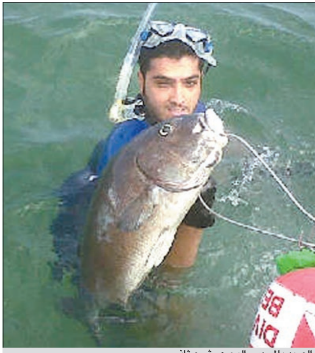
الصيد بالمسدس البحري شيء ثاني