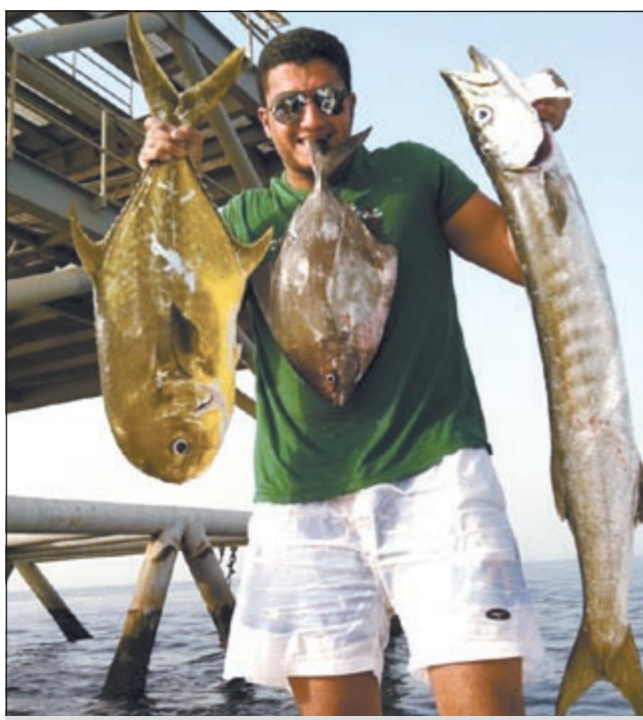
دويلمي وحلو يا يوه وطلاحة المحاذق الجنوبية

اما الآن فاملتكم طرادا بحجم 28 قدم اليوسفي وعليه ماكيتان بقوة 200 حصان لكل ماكيتة.