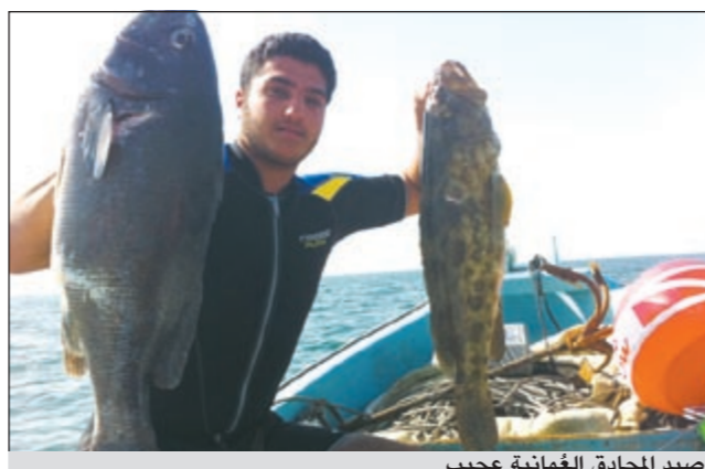
صيد المحاذق الغمانية عجب

ما أفضل أماكن الغوص لديك؟ ● في السابق كنت امتلك طرادا بحجم 21 قدم الروضان وعليه ماكيتة واحدة بقوة 200 حصان