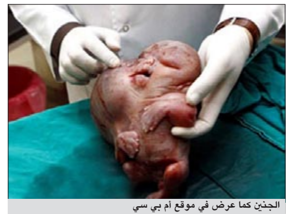
الجنين كما عرض في موقع أم بي سي

القاهرة - ام بي سي. نت: اثار امرأة مصرية دهشة الاطباء بوضعها جنينا، يوم الاحد 26 يونيو، يشبه الكائنات الفضائية، كما يظهرها صانعو افلام الخيال العلمي.