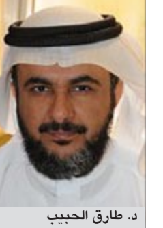
د. طارق الحبيب

وتنتجة للهجمة التي بلغت اوجها اليوم، ووصلت الى توجيه اللعن والشتم بعد هذا الحديث لم يتكف البروفيسور طارق الحبيب بالبيان التوضيحي الذي اعلنه أمس ونشرته «سبق» حيث سارع الى اصدار بيان اعتذار قال فيه: عذرا حبيبي رسول الله ﷺ، ان كنت قد اخطأت في حقك عندما كنت اتكلم عن صناعة الله سبحانه وتعالى لكمالك النبوي، وأضاف في البيان: ان النقص المقصود في العبارة هو فقدان حنان الأم فقط، وليس النقص في ذاته الكريمة، بابي وأمي انت يا رسول الله وهو ما اشرت إليه كأحد الأسباب للاقتران بأم المؤمنين خديجة رضي الله عنها، ولم ترد تلك الكلمة بالمعنى الاجتماعي الدارج في المجتمعات.