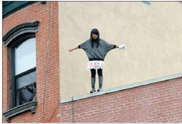
تقف على حافة المبنى مهددة بالقفز